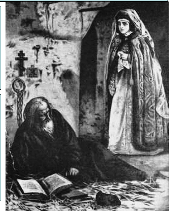
Боярыня Морозова навещает протопопа Аввакума в тюрьме.

Сторону «ревнителй» принимали многие знатные и богатые бояре, церковные иерархи, крестьяне и посадские люди. В Москве происходили волнения противников реформ Никона