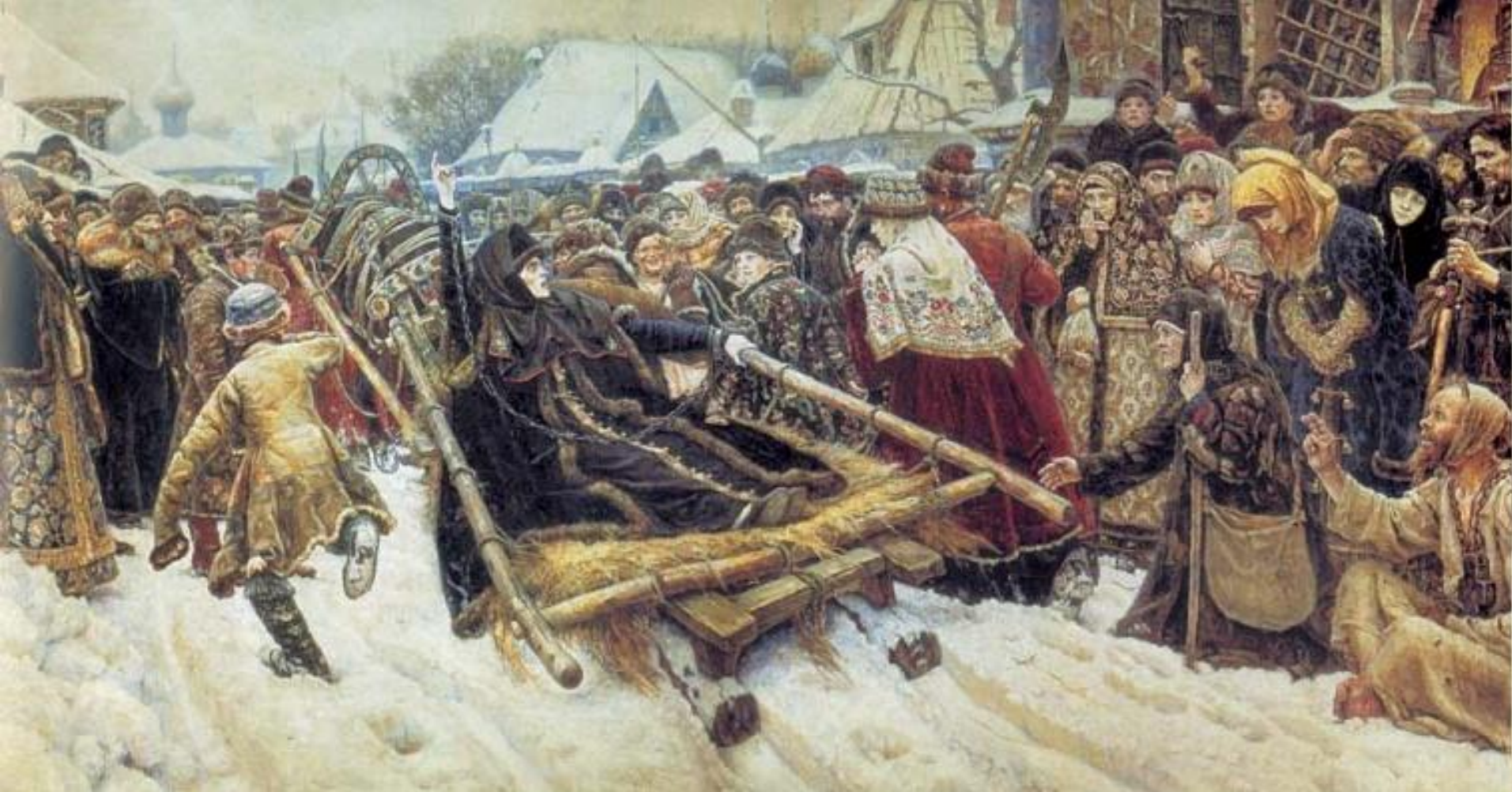
В.И. Суриков. Боярыня Морозова. 1887 г.

Боярыня Морозова была противницей реформ патриарха Никона, тесно общалась с апологетом старообрядчества - протопопом Аввакумом