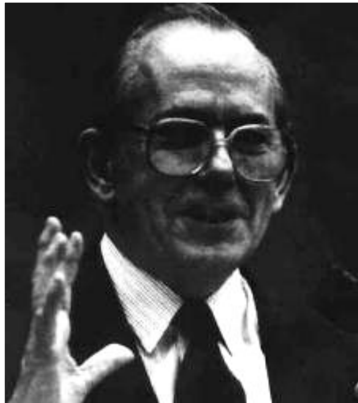
Мишель Камдессю. Распорядительный директор МВФ.

МВФ поставил перед правительством задачи-снизить социальные расходы, дать гарантии иностранным инвесторам, снизить инфляцию.