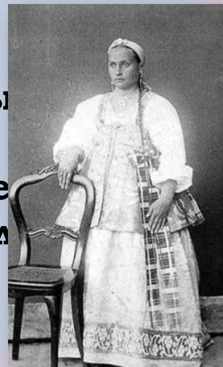
Северное или приморское