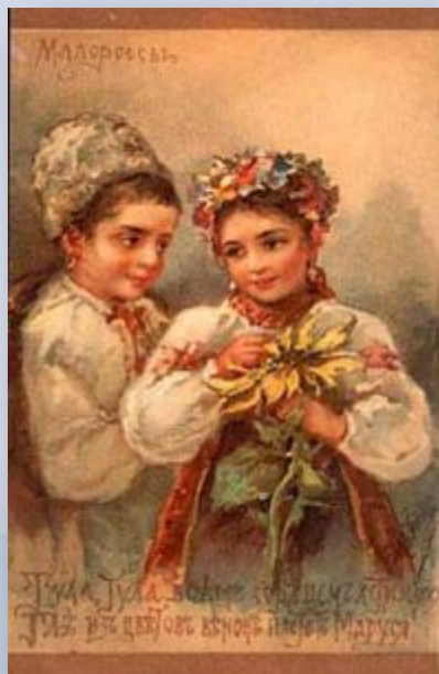
Украинское или малороссийское