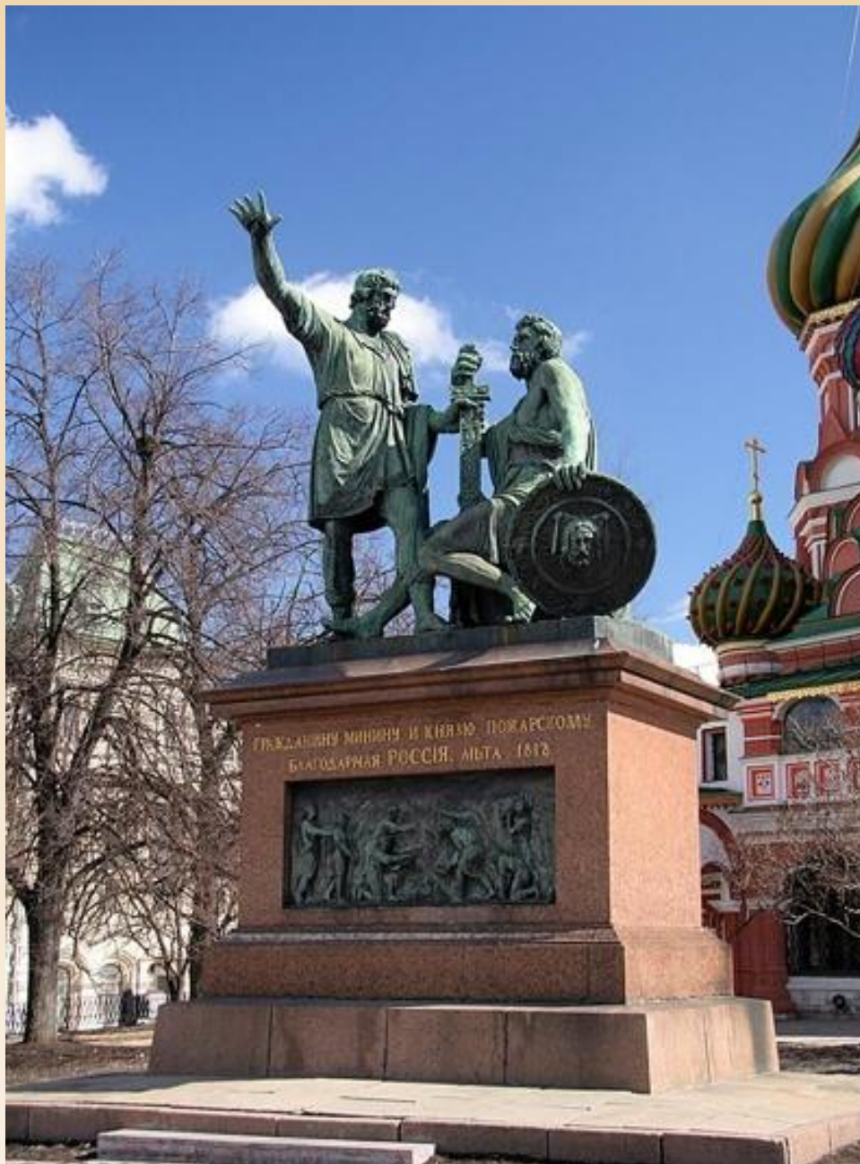
Памятник Минину и Пожарскому в Москве.