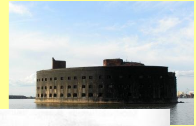
Восстание в Кронштадте (март 1921г.)

В 1920-1921гг. По Советской России прокатилась волна рабочих забастовок и крестьянских восстаний под лозунгом «Советы без коммунистов»