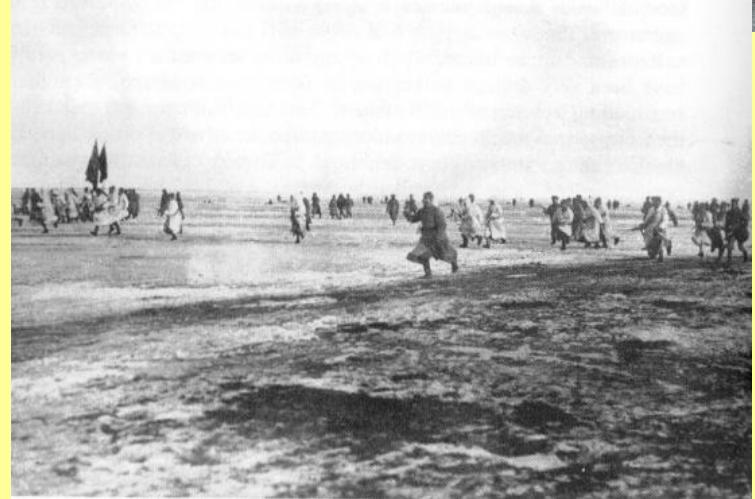
Тамбовские крестьяне против Советской власти