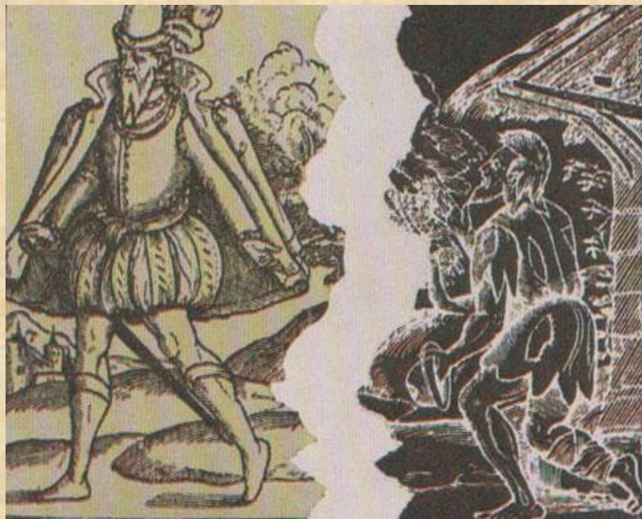
Богатый модник и бродяга – оборванец (гравюра конца XVI века)