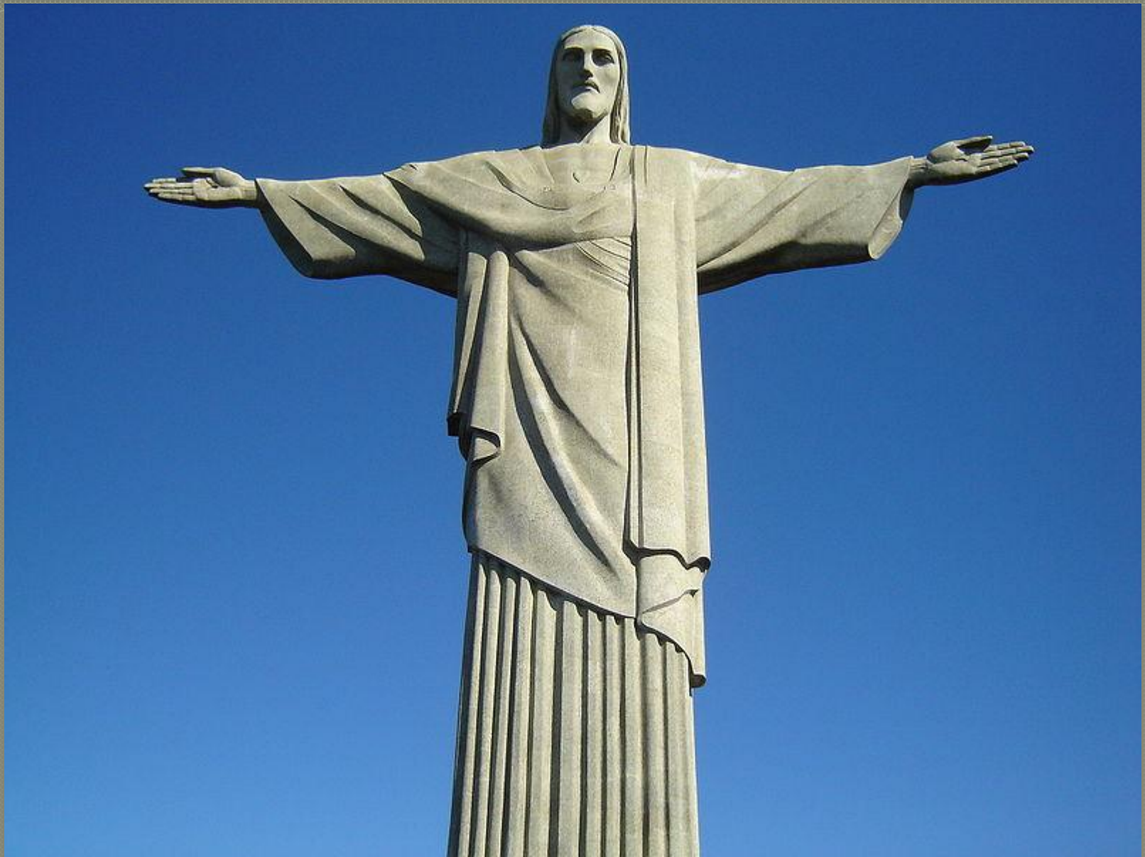
Статуя Христа-Искупителя (Бразилия)