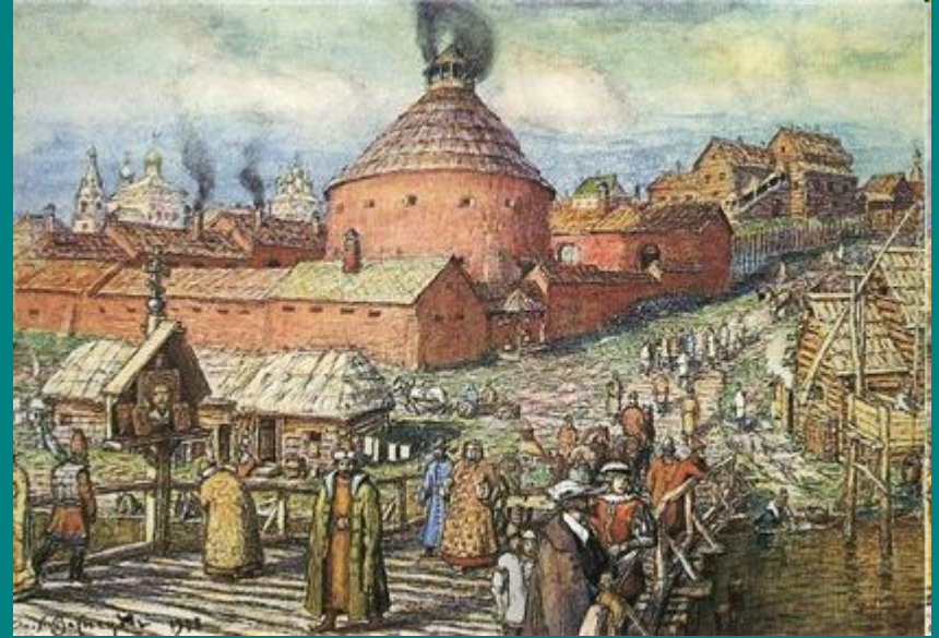
Пушечный двор в Москве — первая русская мануфактура.