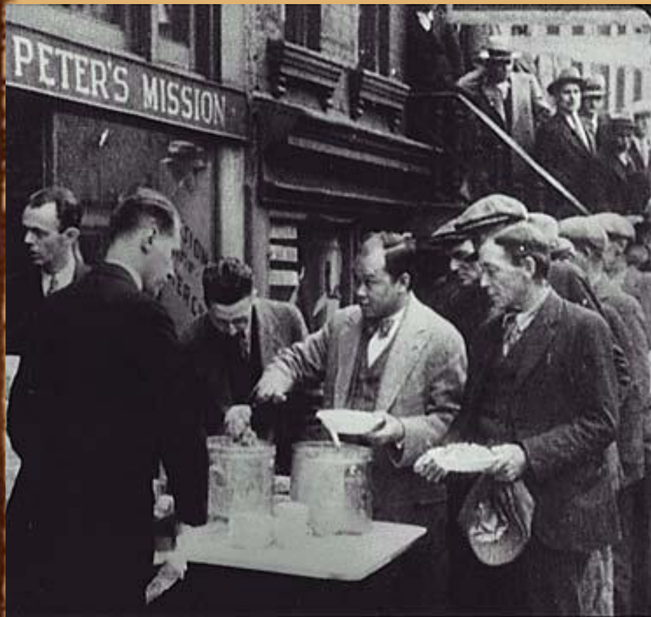
Очереди в столовые