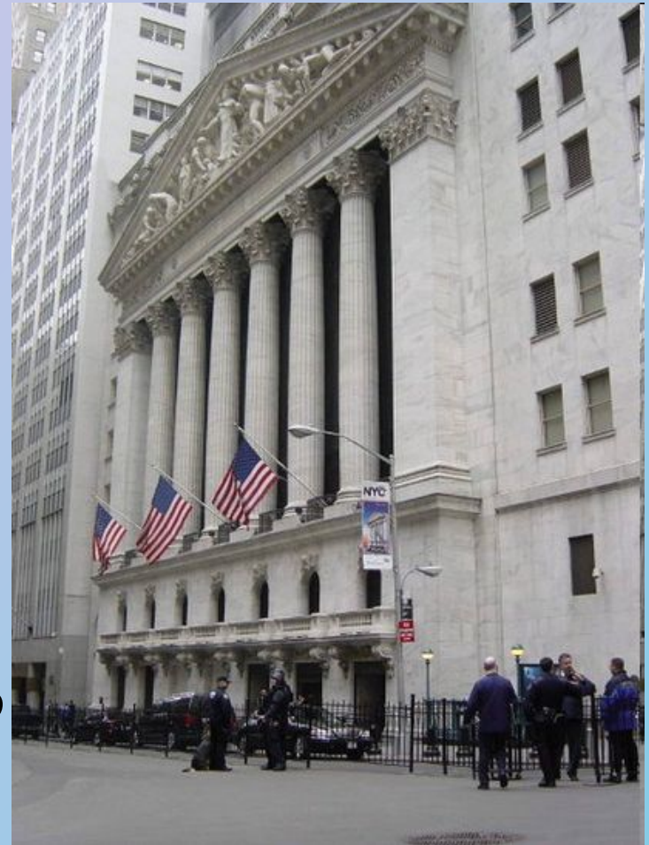
Нью-Йоркская фондовая биржа

• В результате государственного регулирования банковской сферы произошел поворот в ее укреплении и повышении надежности