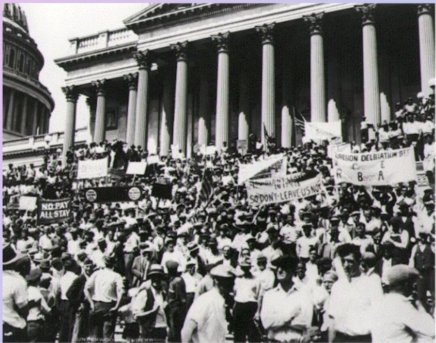
Демонстрация. Вашингтон 1932г