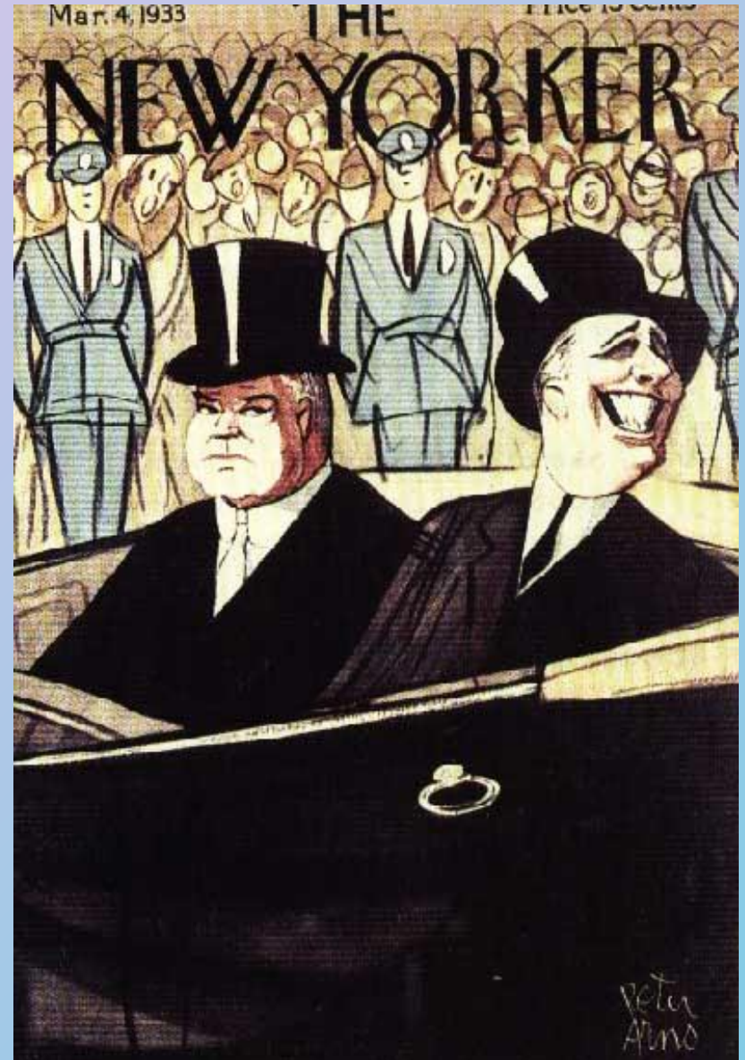
Гувер и Рузвельт