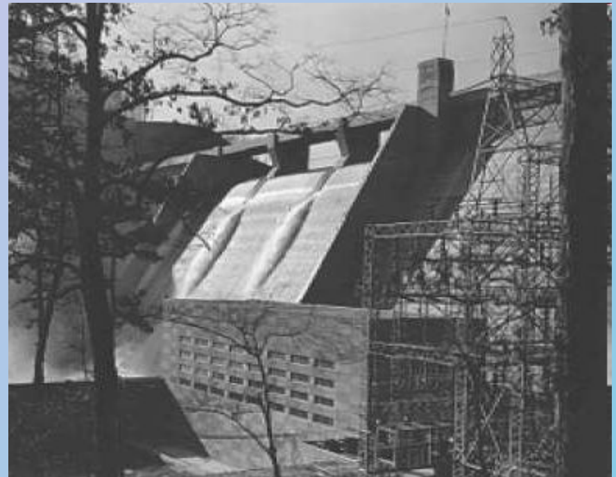
Строительство дамб в бассейне реки Теннесси

только в долине реки Теннесси было построено 25 электростанций, река стала судоходной, была остановлена эрозия почвы, поднялись молодые леса