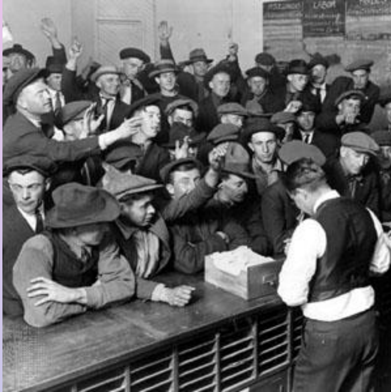
На бирже труда