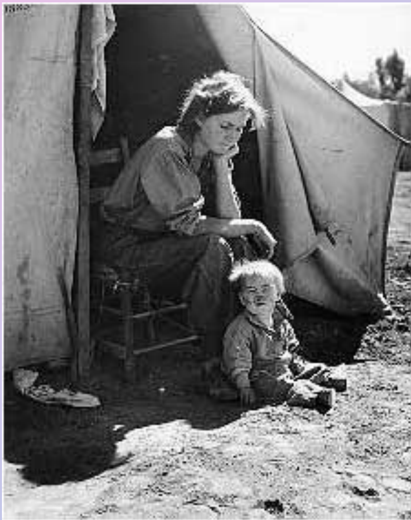
Без дома и без

1. Признание принципов коллективно-договорной практики в качестве национальной политики США и механизма регулирования конфликтующих интересов рабочих и предпринимателей