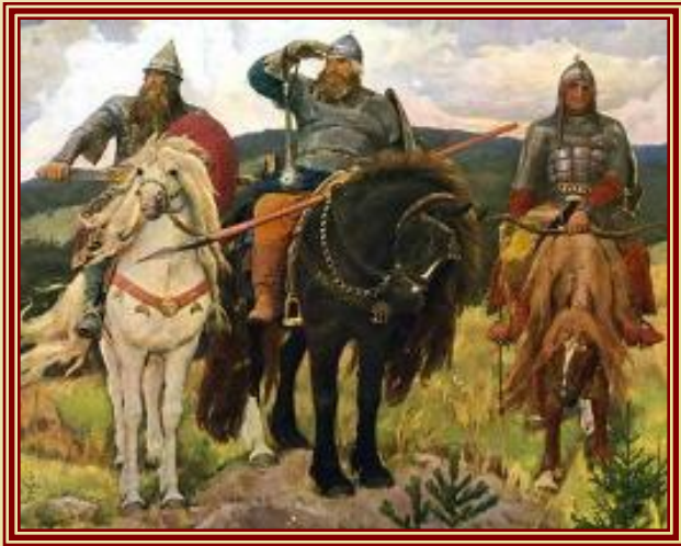
↑ Добрыня Никитич