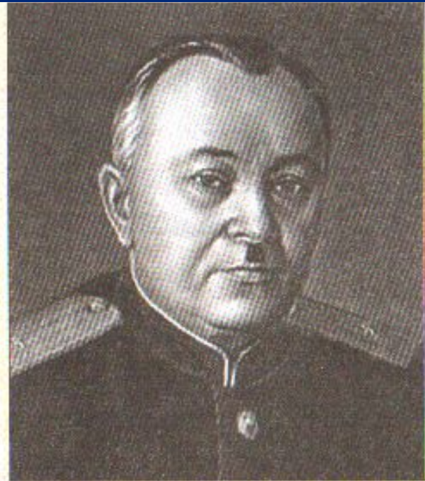
А.В. Александров. Автор музыки гимна нашей страны