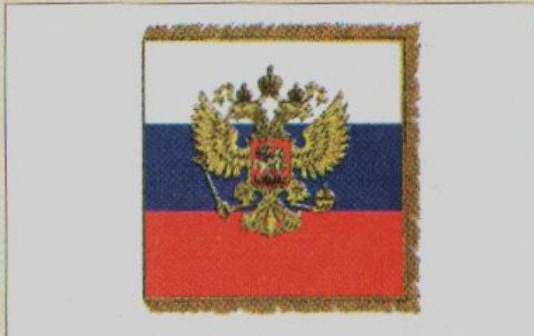
Штандарт Президента Российской Федерации