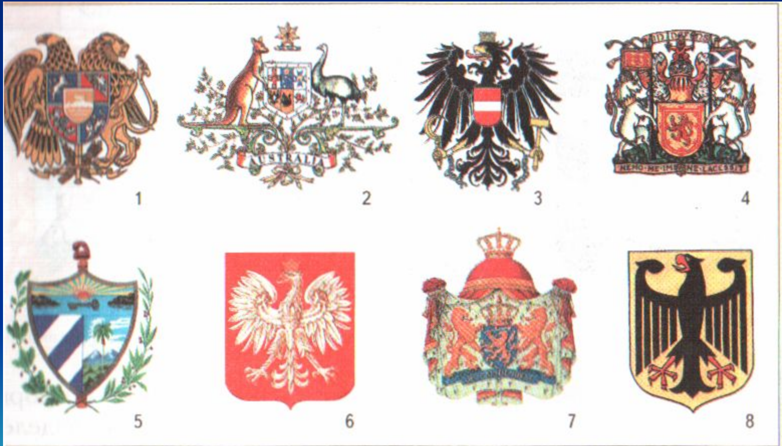
Изображения гербов иностранных государств: 1 — Армения; 2 — Австралия; 3 — Австрия; 4 — Шотландия; 5 — Куба; 6 — Польша; 7 — Нидерланды; 8 — Германия