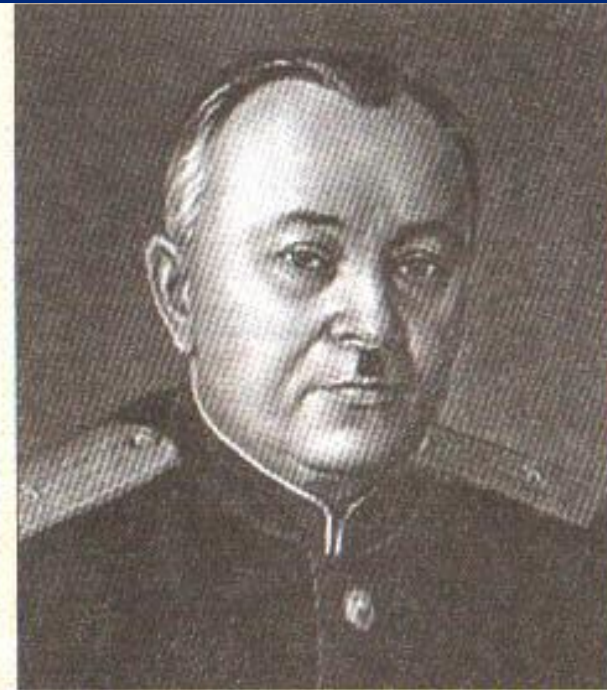
А.В. Александров. Автор музыки гимна нашей страны