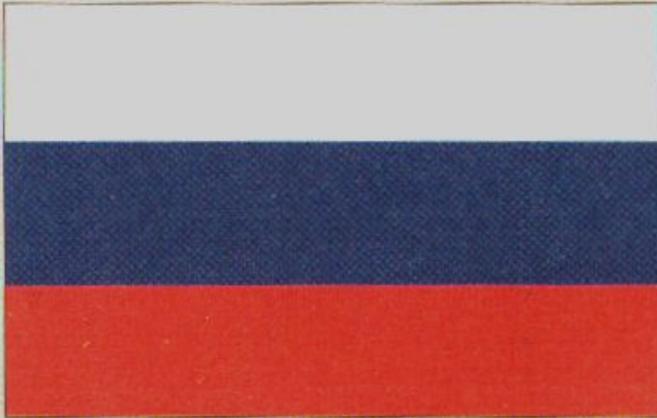
Флаг Российской Федерации