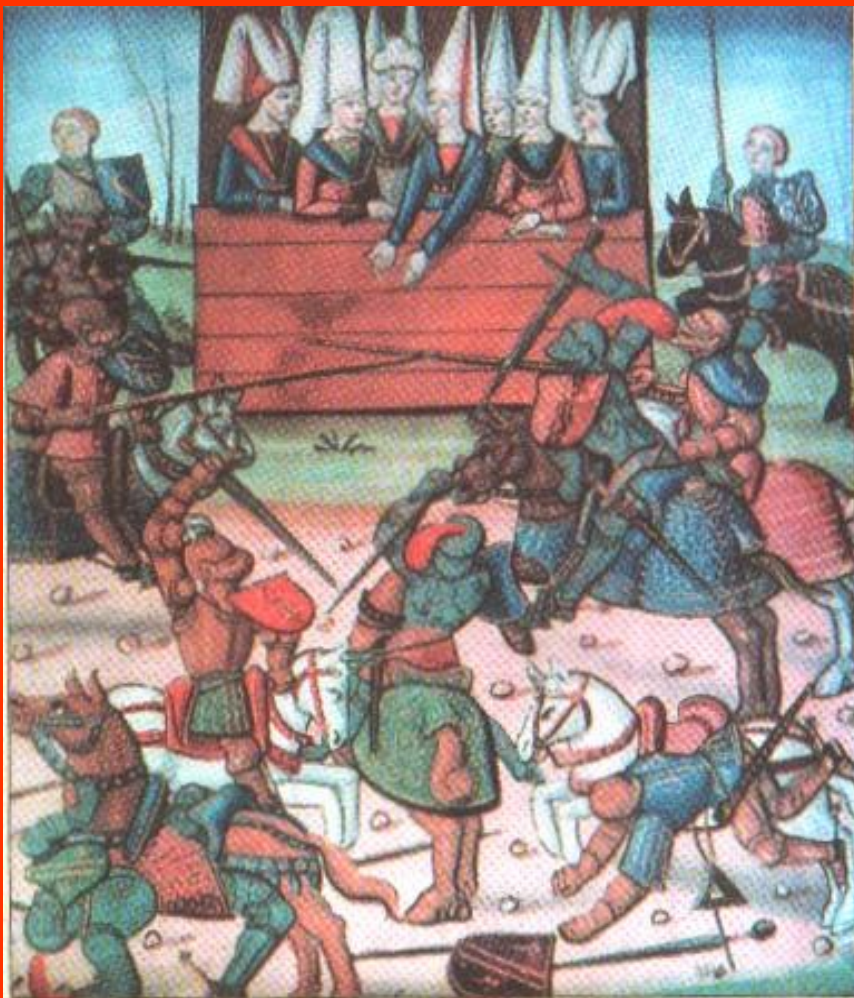
«Рыцарский турнир». Книжная миниатюра. Вторая половина XV в.

В XIII—XV вв. любимым развлечением жителей Западной Европы были состязания воинов-рыцарей. Эти состязания называли рыцарскими турнирами. Лица воинов были полностью закрыты шлемами. Для зрителей они оставались неузнаваемыми. Тогда и появилась необходимость на одежде или доспехах участника турнира помещать отличительный знак — герб, принадлежавший только ему.