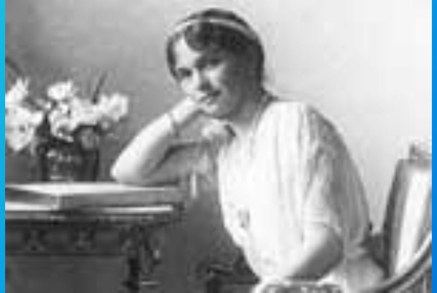
Великая Княжна Ольга

Пошли нам ,Господи, терпенье В годину буйных, мрачных дней, Сносить народное гоненье И пытки наших палачей. И у преддверия могилы Вдохни в уста Твоих рабов Нечеловеческие силы – Молиться кротко за врагов.