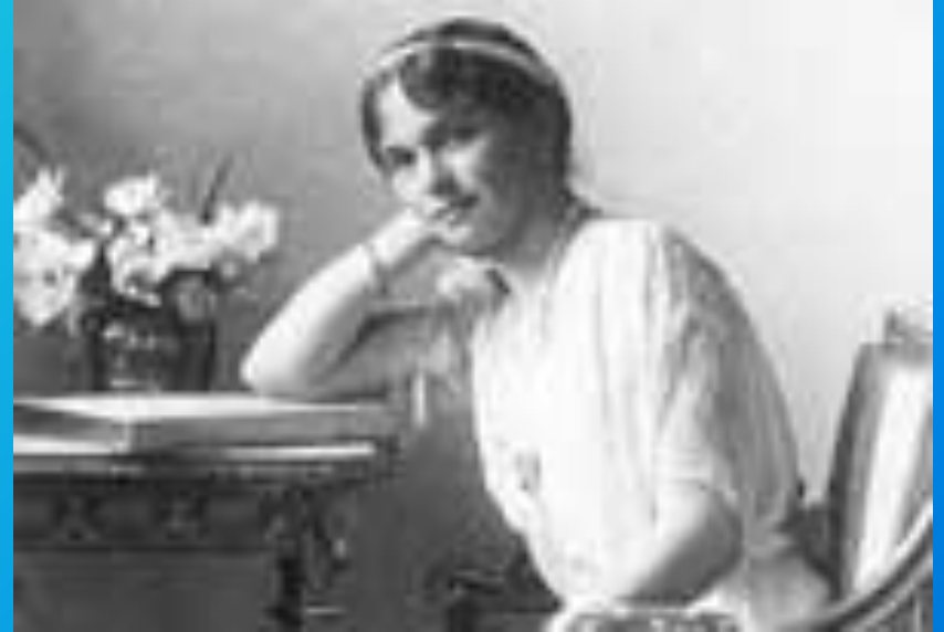
Великая Княжна Ольга

Пошли нам ,Господи, терпенье В годину буйных, мрачных дней, Сносить народное гоненье И пытки наших палачей. И у преддверия могилы Вдохни в уста Твоих рабов Нечеловеческие силы – Молиться кротко за врагов.