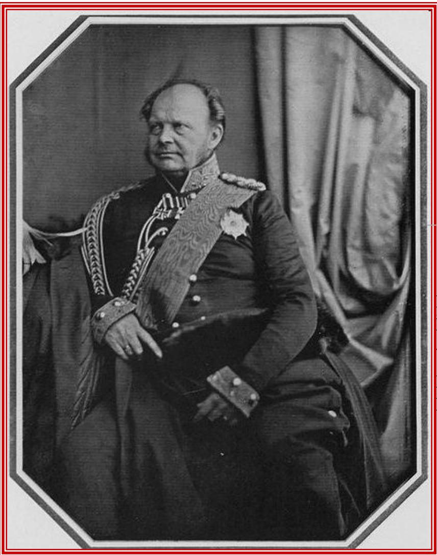
Фридрих Вильгельм IV - король Пруссии (1840-1861)

Король Фридрих Вильгельм IV отверг конституцию. Затем конституцию отвергли руководители многих германских государств.