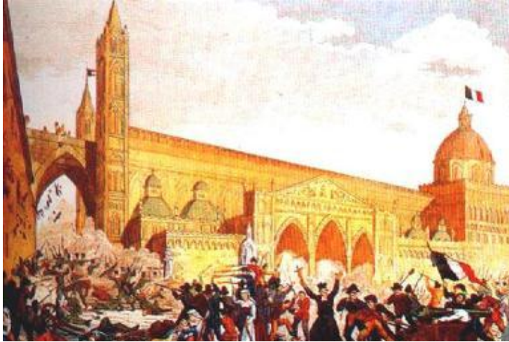
Восстание в Палермо.