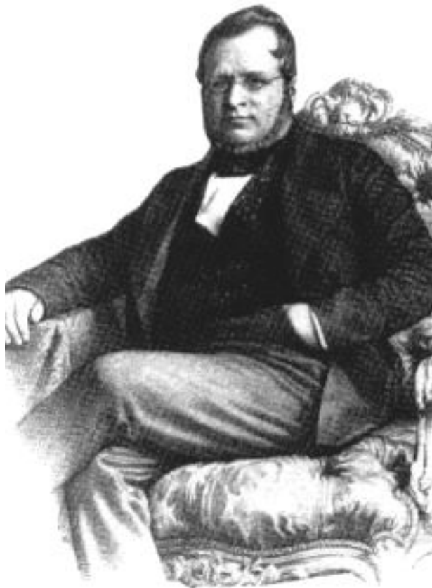
Граф Кавур. Гравюра 2- пол.19 в.