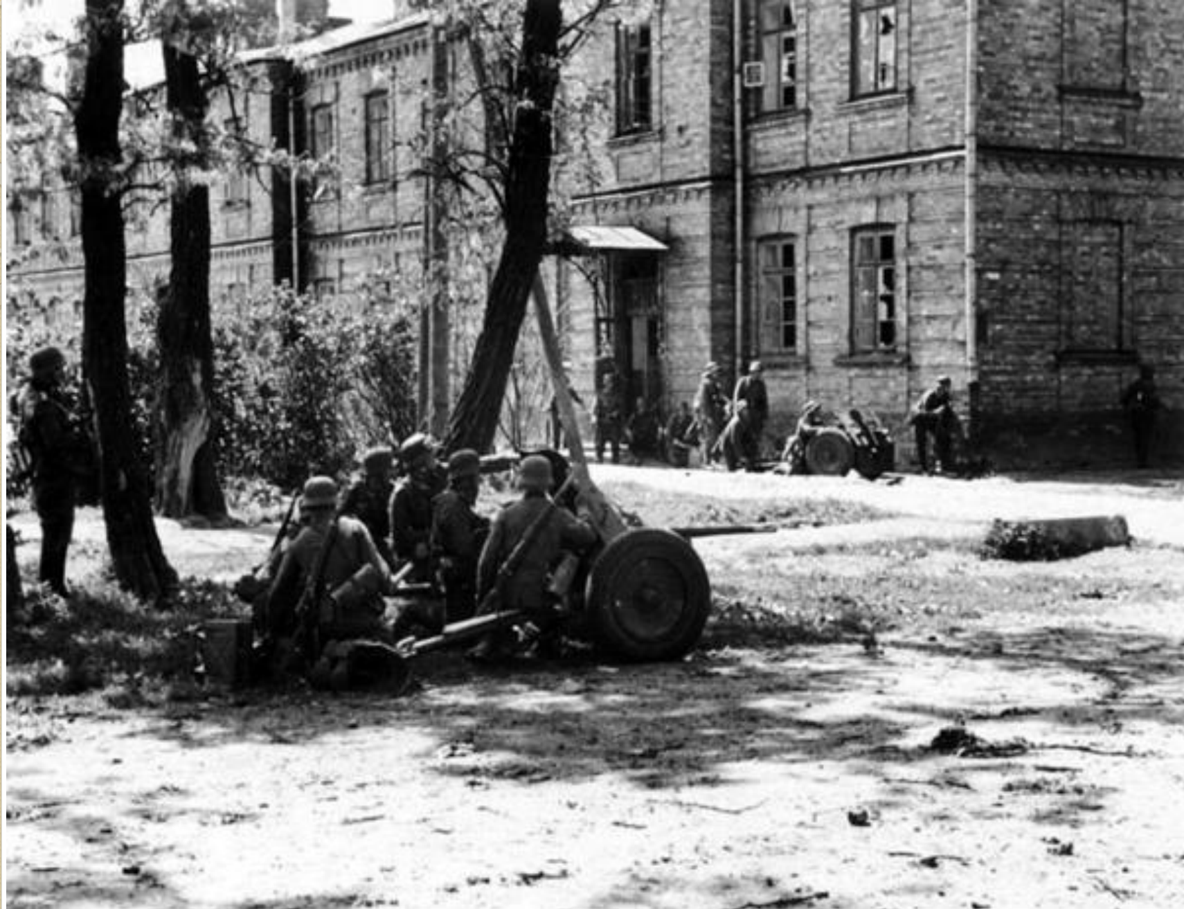
Немцы на улицах Бреста. У стены здания – 75-мм легкое пехотное орудие le.I.G.18, на переднем плане 37-мм противотанковая пушка PaK-35/36.