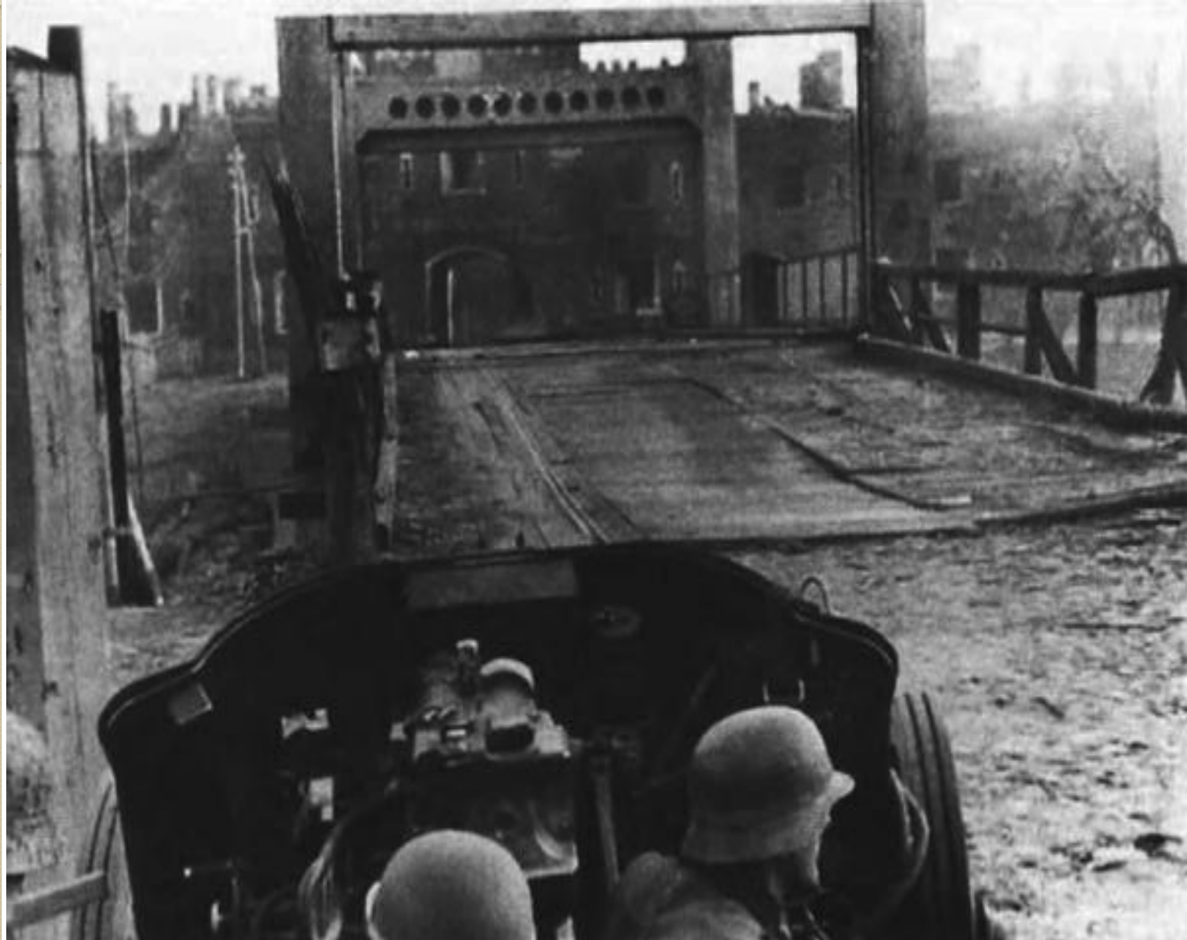
50-мм противотанковое орудие PaK-38 на фоне Холмских ворот.