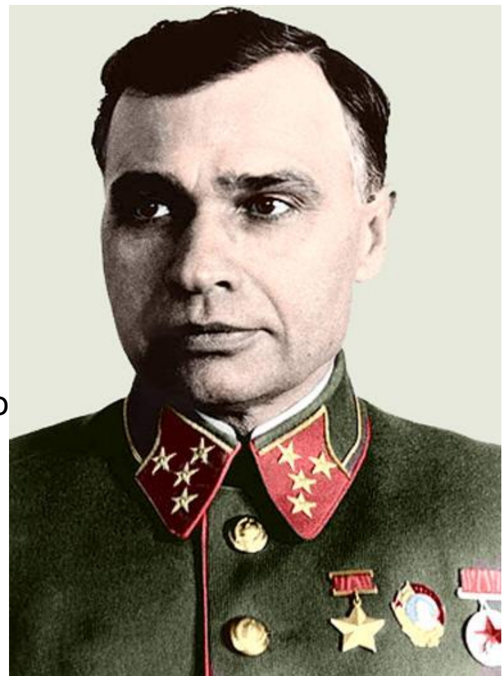
Командувач Південно-Західним фронтом генерал- полковник Кирпонос

У середині липня 17А ( нім. ) почала активний наступ в напрямку м. Вінниця. 12- я армія ( П. Г. Понеделина ) змушена була залишити місто . До того ж між 26- й і 6 -й арміями утворився широкий розрив фронту в районі м. Біла Церква . Ці фактори змусили радянське командування відводити 6- ю і 12 -у армії в район Умані. Але до кінця місяця німецькі танкові частини змогли нагнати відходять і разом з піхотою 17- ї німецької армії утворити Уманський котел .