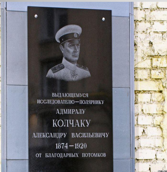
Мемориальная доска в Санкт-Петербурге