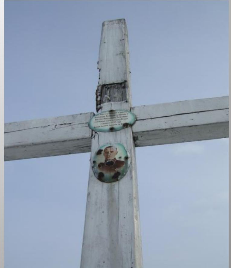
Крест-памятник А.В. Колчаку в Иркутске