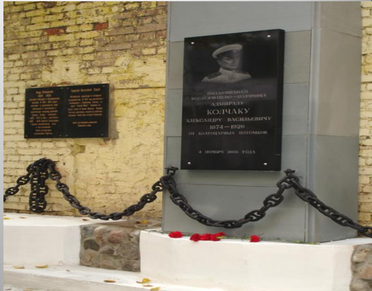
Мемориальная доска в Москве