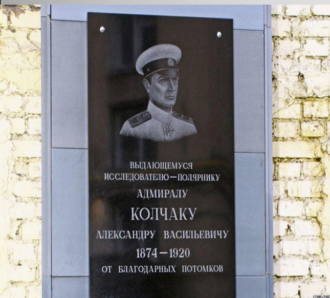
Мемориальная доска в Санкт-Петербурге