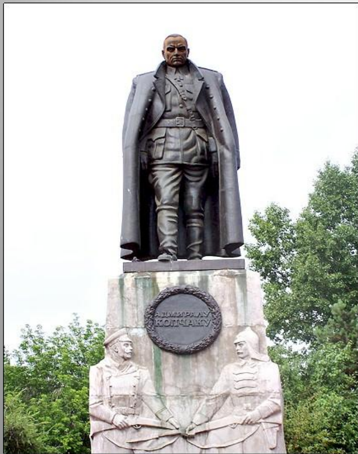
Памятник А.В. Колчаку в Иркутске