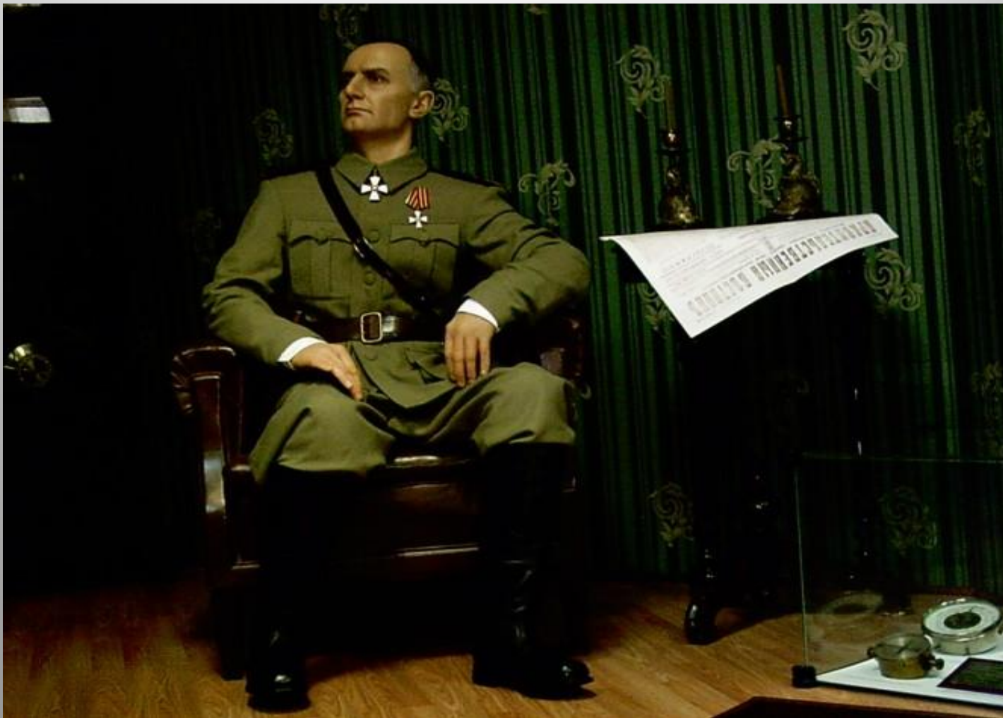
Восковая фигура А.В. Колчака в историко-краеведческом музее г. Омска