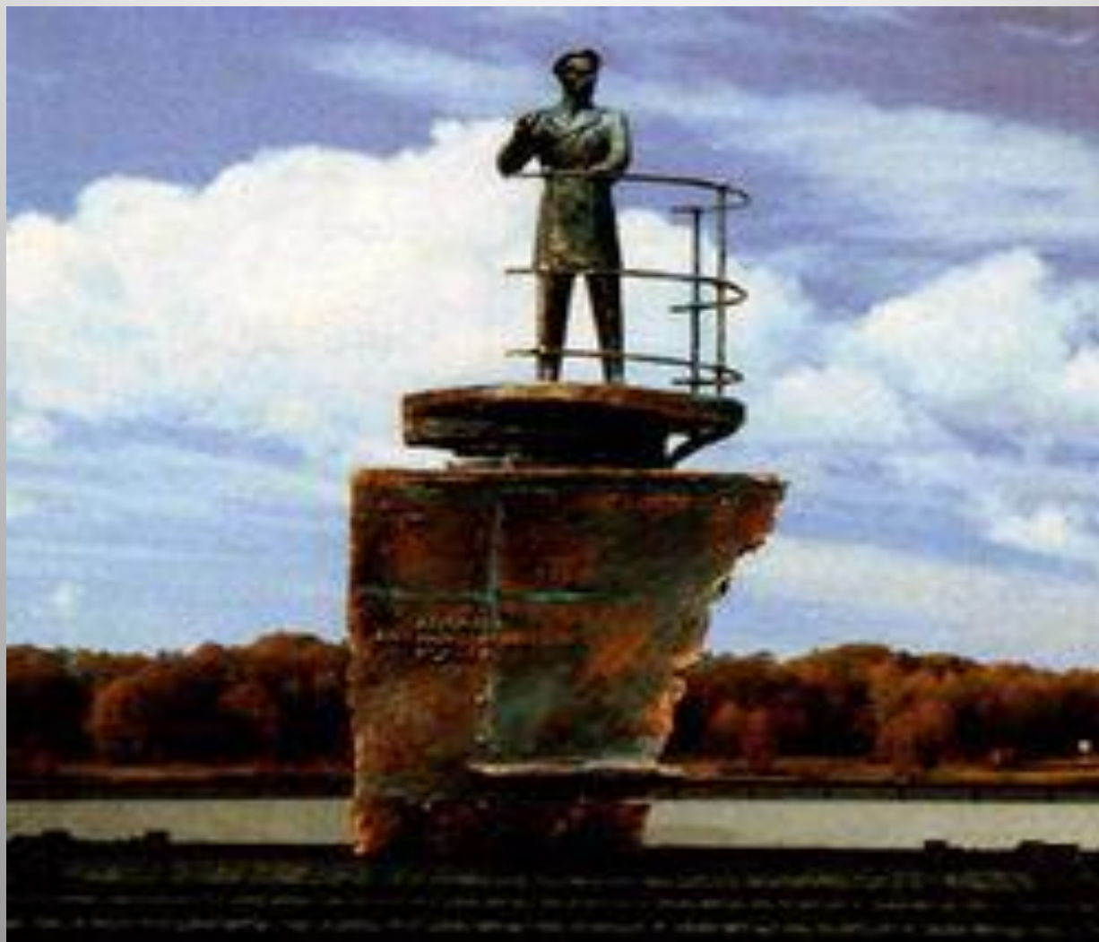
Памятник в Омске