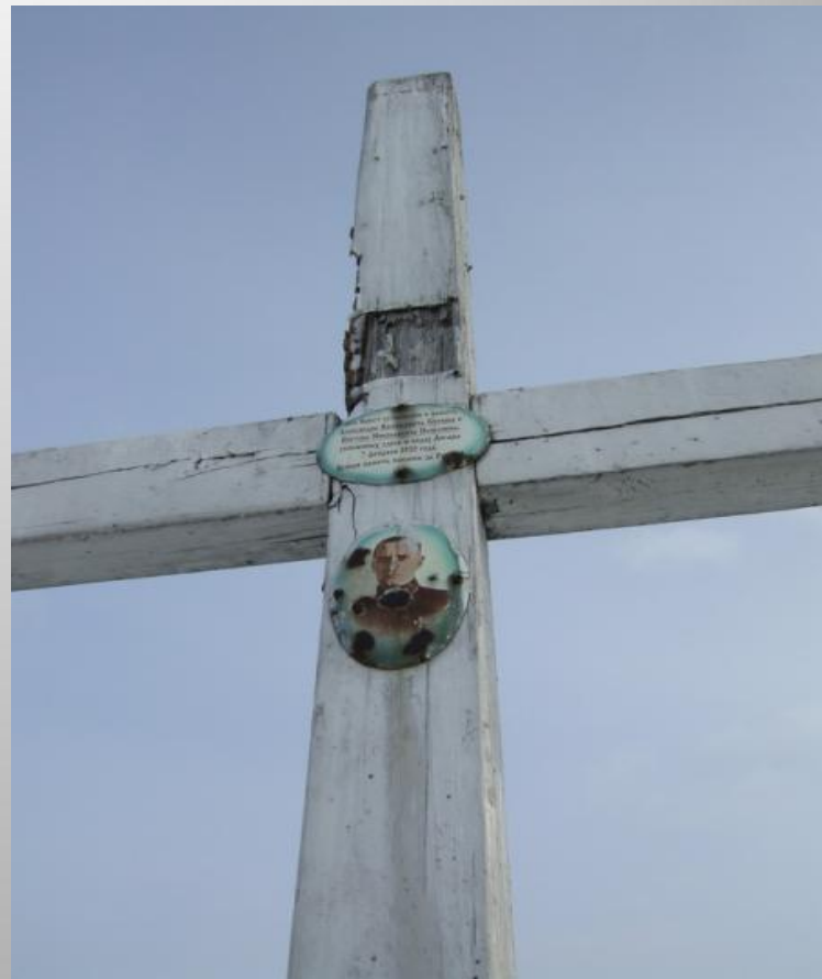
Крест-памятник А.В. Колчаку в Иркутске