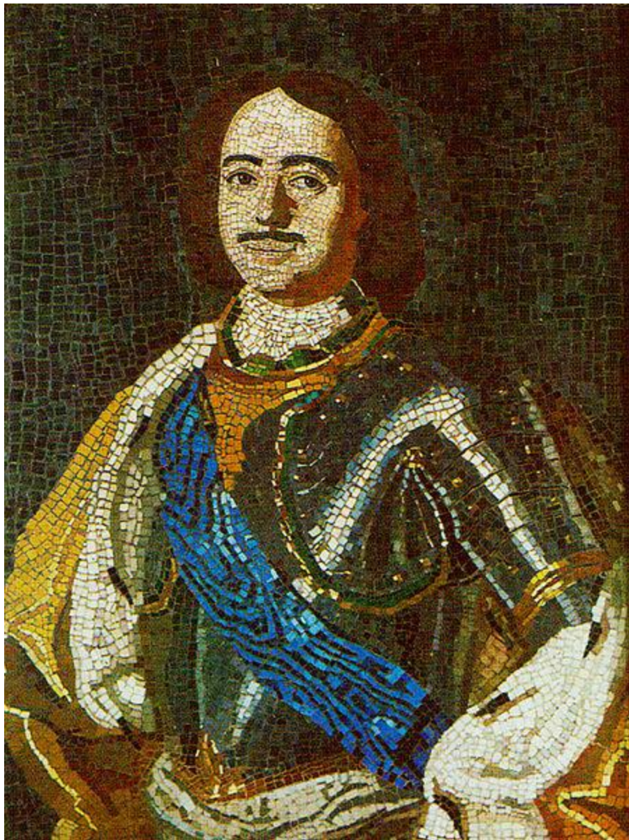
Портрет Петра I. Мозаика. Набрана М. В. Ломоносовым. 1754. Усть-Рудицкая фабрика