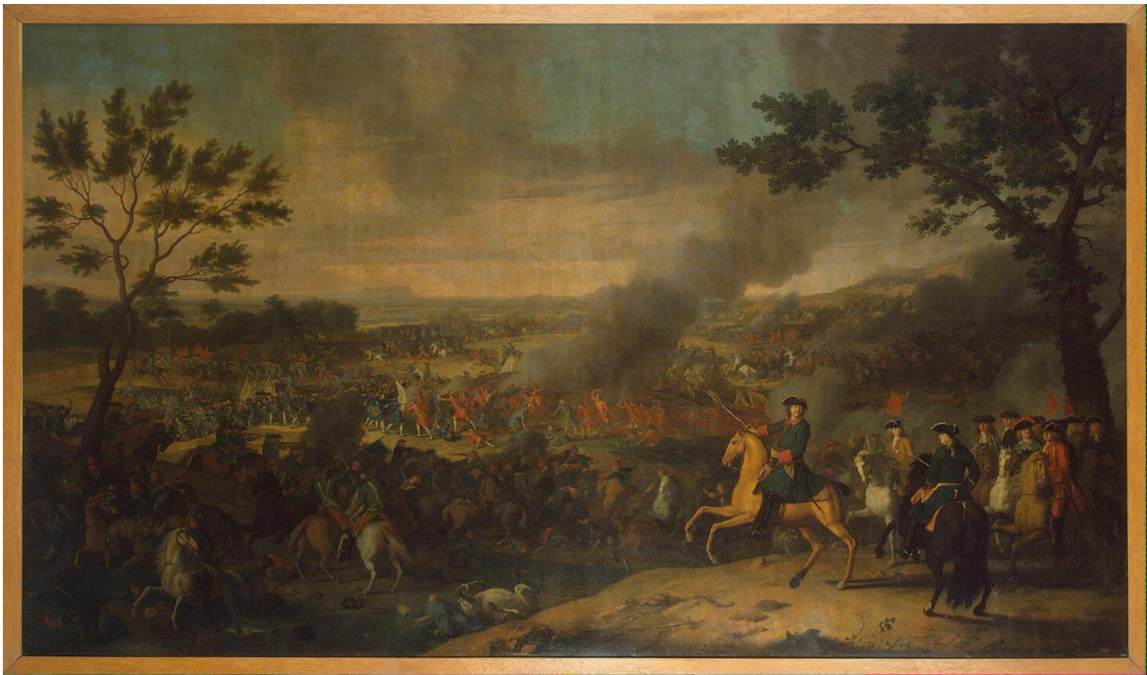
Пётр I в Полтавской битве. Л. Каравак 1717 г.