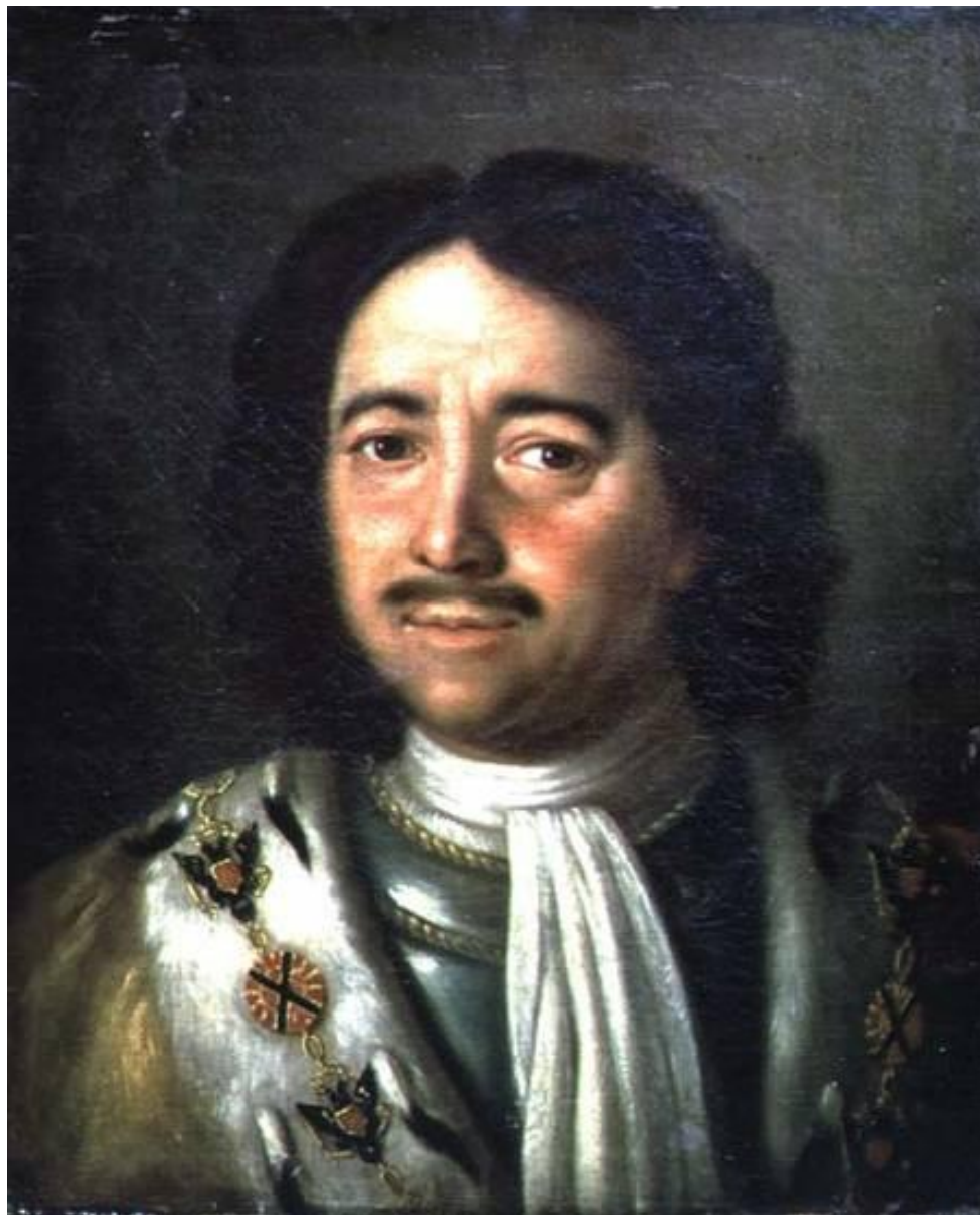
Алексей Петрович Антропов . Петр Великий.