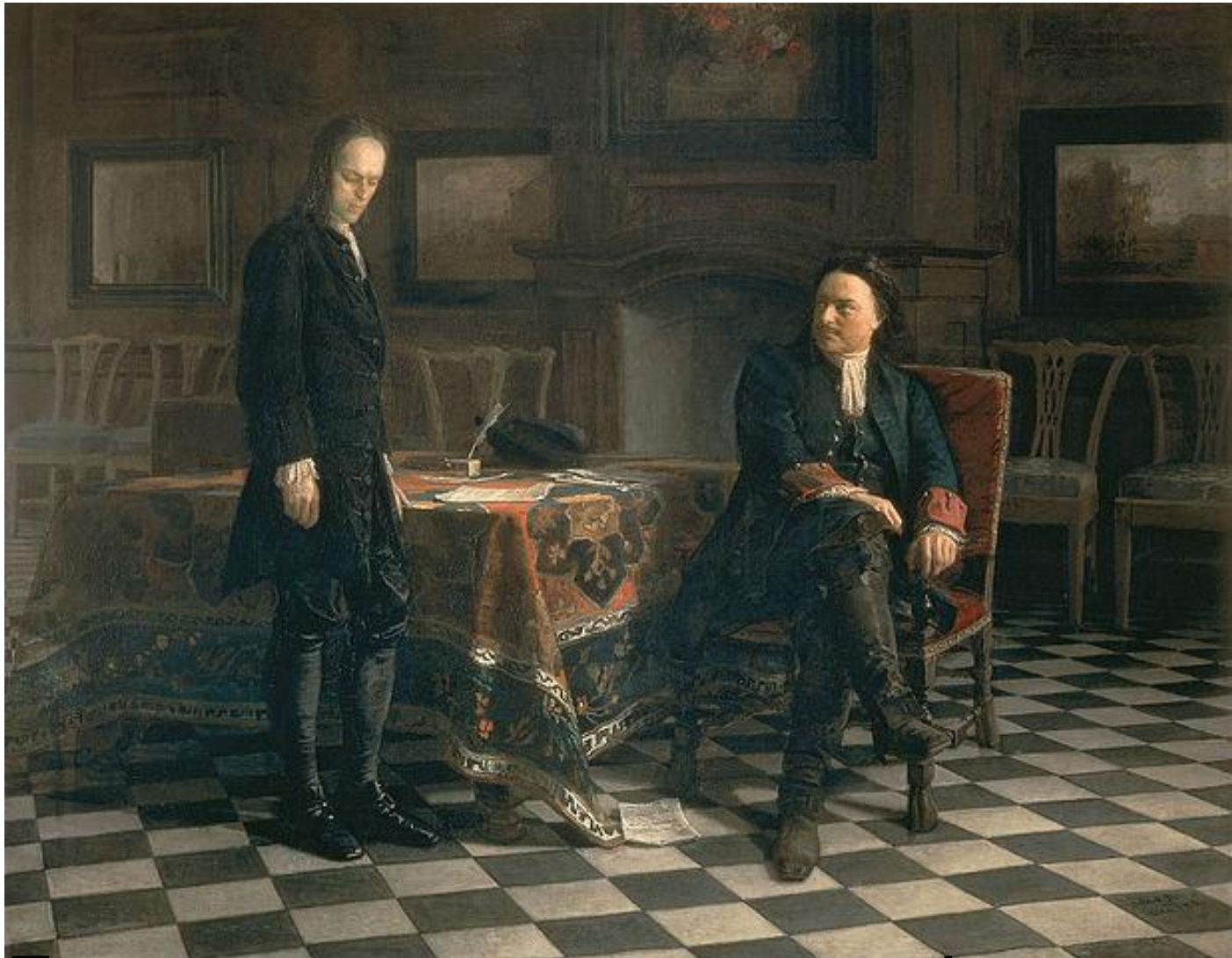
Петр I допрашивает царевича Алексея Петровича в Петергофе», картина Николая Ге, 1871 г.