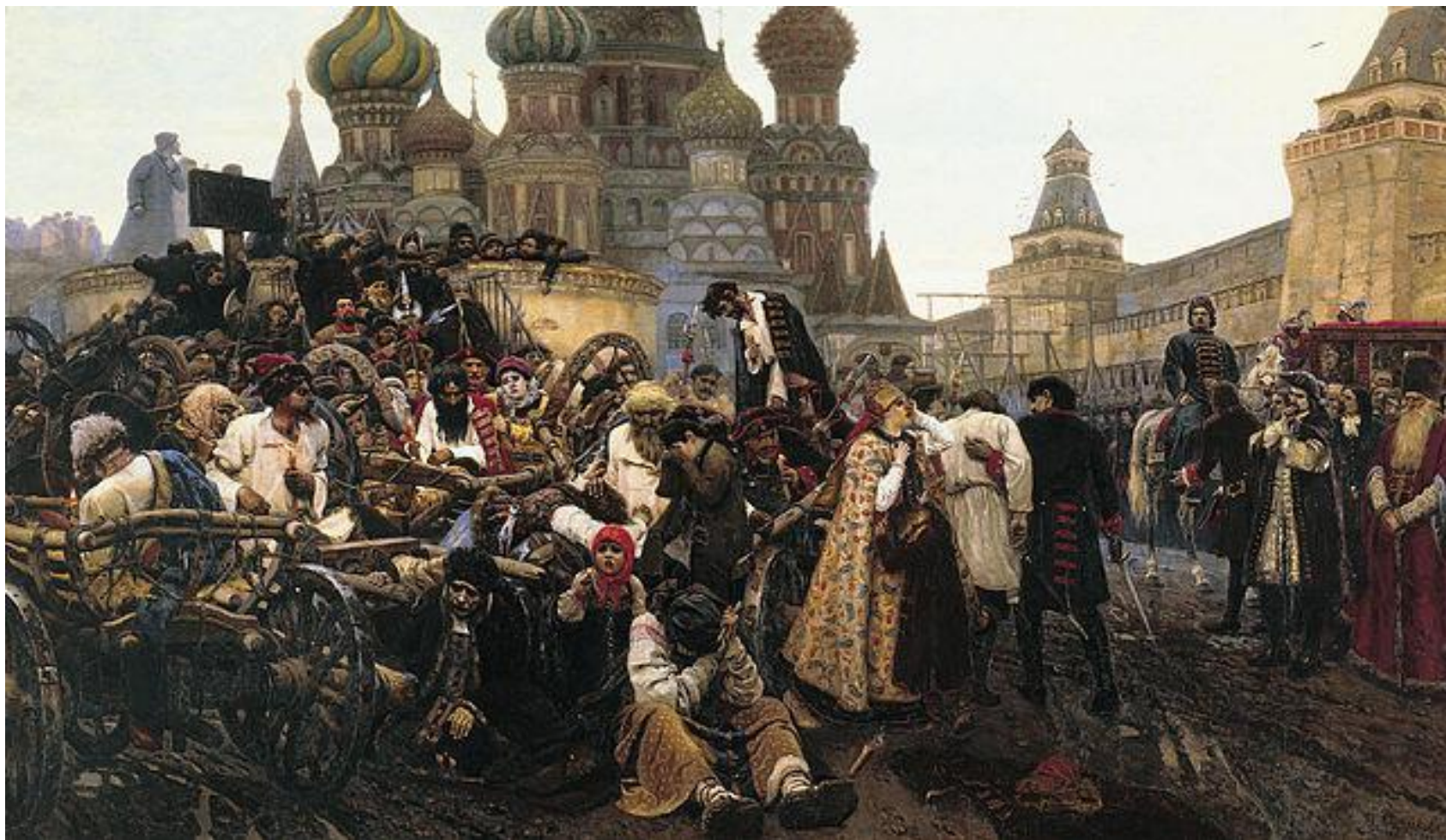
В.А.Суриков. Утро Стрелецкой казни. (1881)