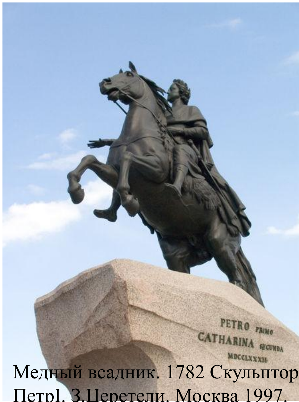
Медный всадник. 1782 Скульптор Э.Фальконе С.Петербург. Петр I. З.Церетели. Москва 1997.