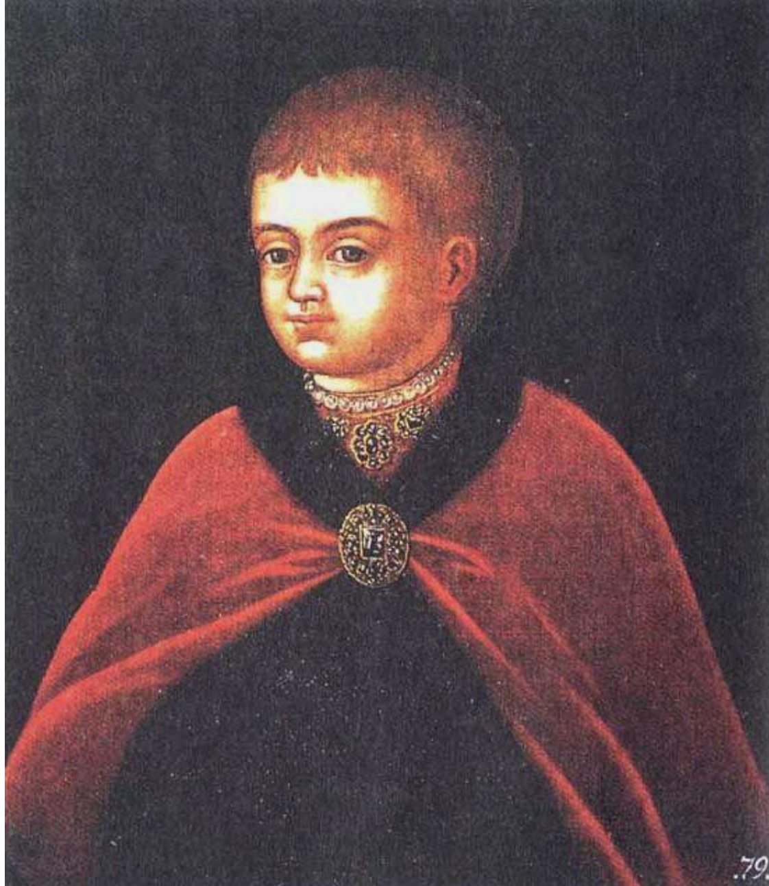
Парсуна XVII века