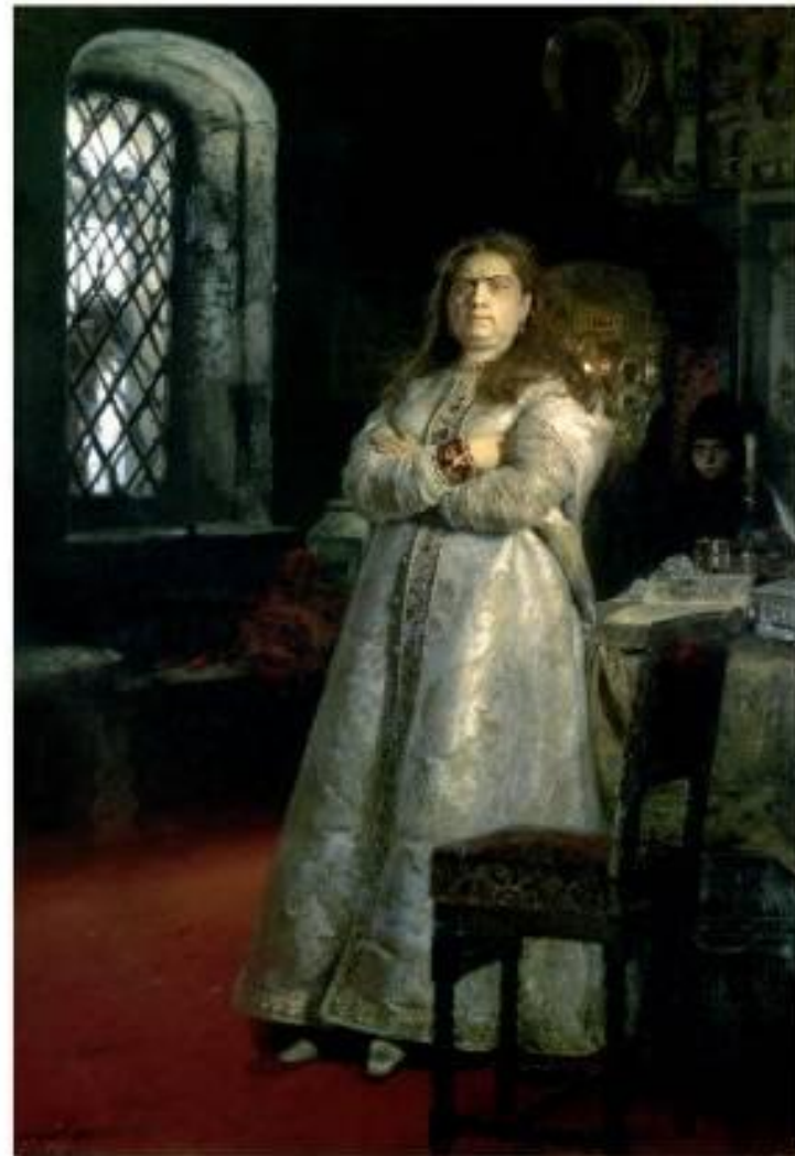
И.Репин Царевна Софья в Новодевичьем монастыре