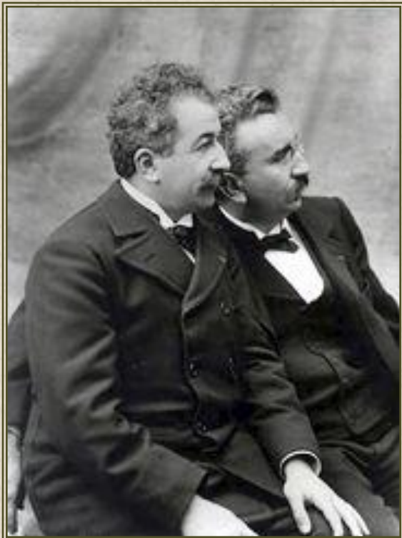
Братья Луи и Огюст Люмьер

Официально считается, что кинематограф берёт своё начало 28 декабря 1895 года. В этот день в индийском салоне «Гран-кафе» на бульваре Капуцинов состоялся публичный показ «Синематографа братьев Люмьер».