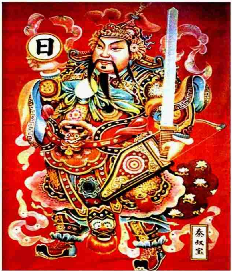
Цинь Шихуан Древнекитайский рисунок

До 3 в. до н.э. в Китае существовало 7 царств.