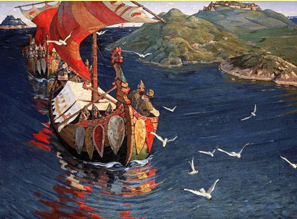
Заморские гости. Худ. Н. Рерих