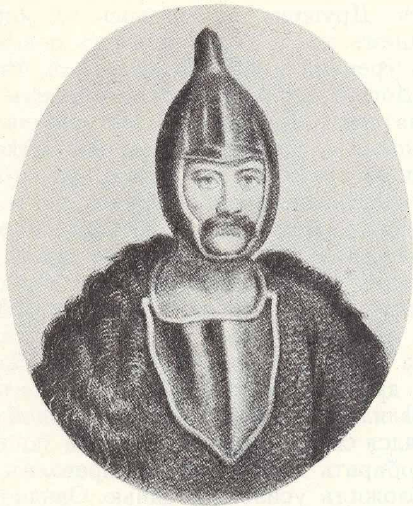
Князь Игорь Рюрикович (877 – 945)