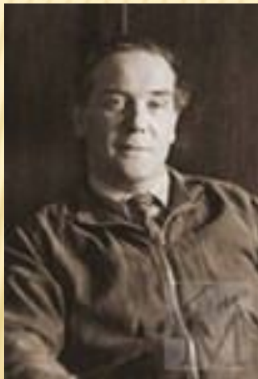
КАПИЦА Петр Леонидович (1940-е годы)

Значительным был вклад ученых-математиков П. С. Александрова, С. Н. Бернштейна, И. М. Виноградова, Н. И. Мусхелишвили.