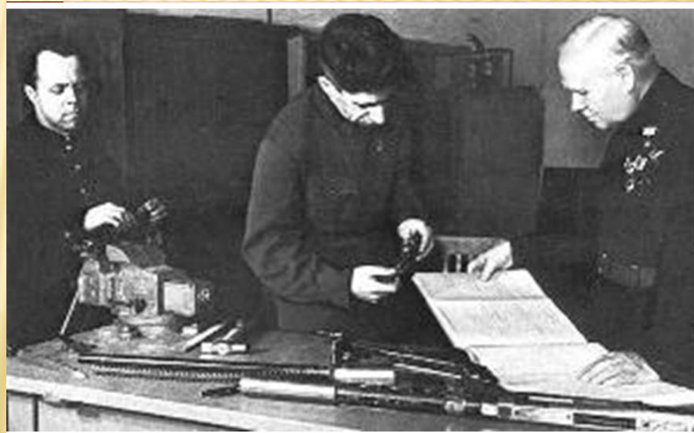
Конструктор П. Дегтярев