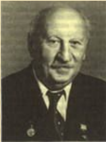
А. Ф. Иоффе