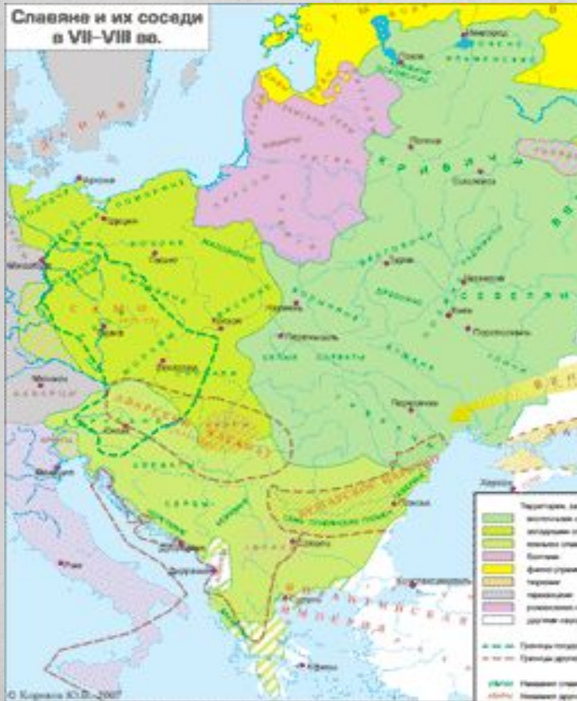
Славяне и их соседи в VII–VIII вв.

Киевская Русь возникла на торговом пути «из варяг в греки» на землях восточнославянских племен — ильменских словен, кривичей, полян, охватив затем древлян, дреговичей, полчан, радимичей, северян, вятичей.