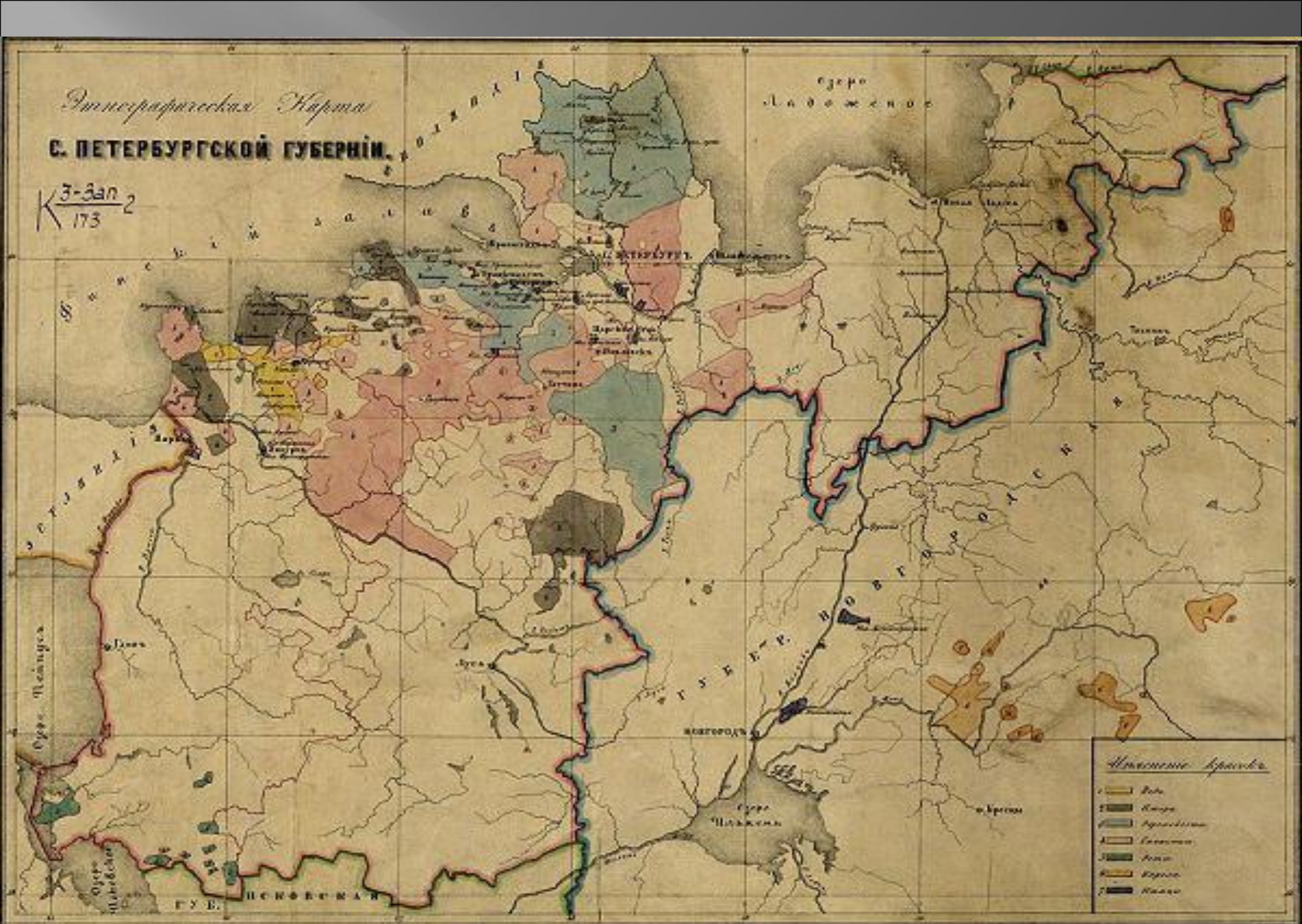
Губернская реформа 1708г.