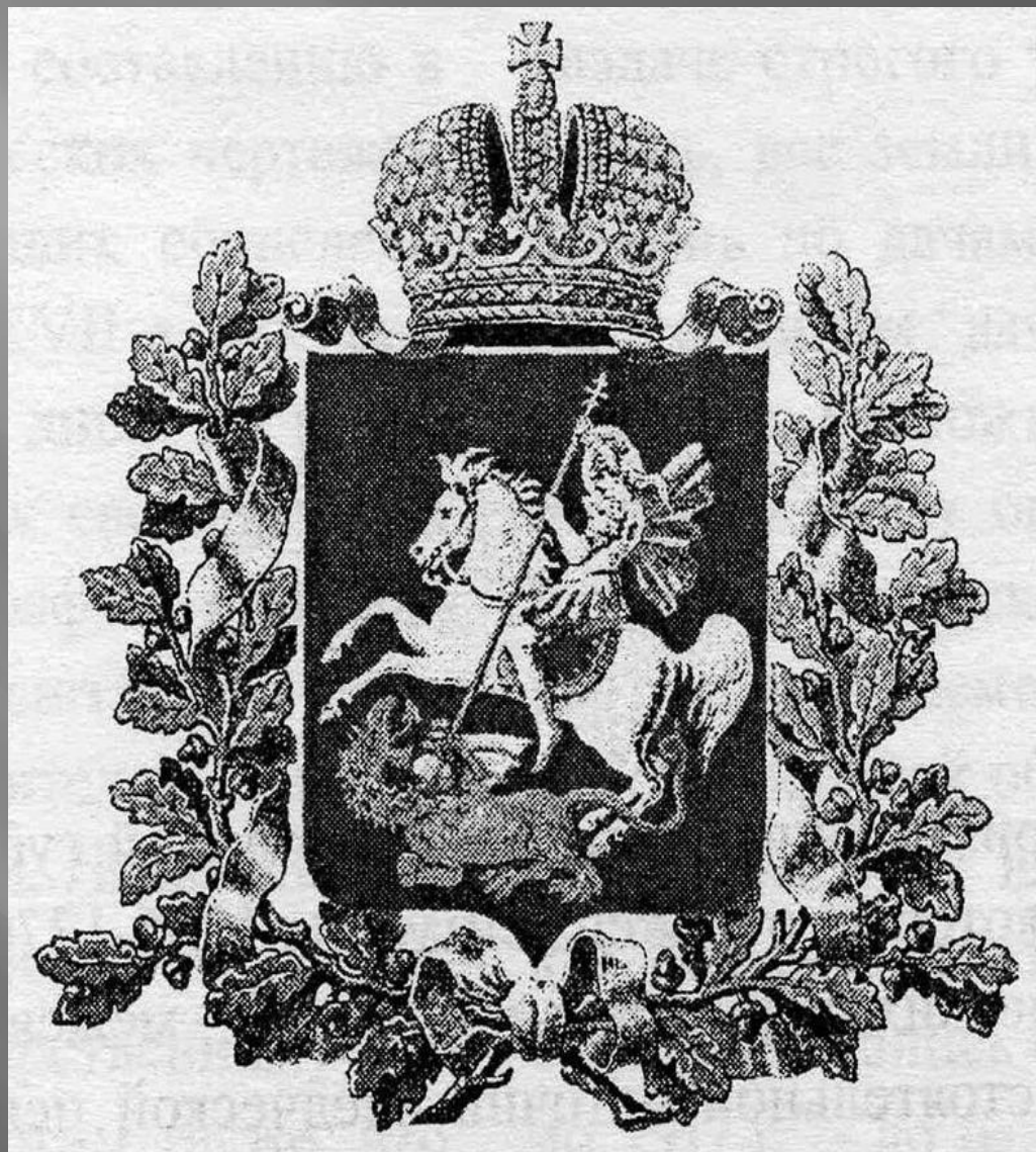
Герб Московской губернии