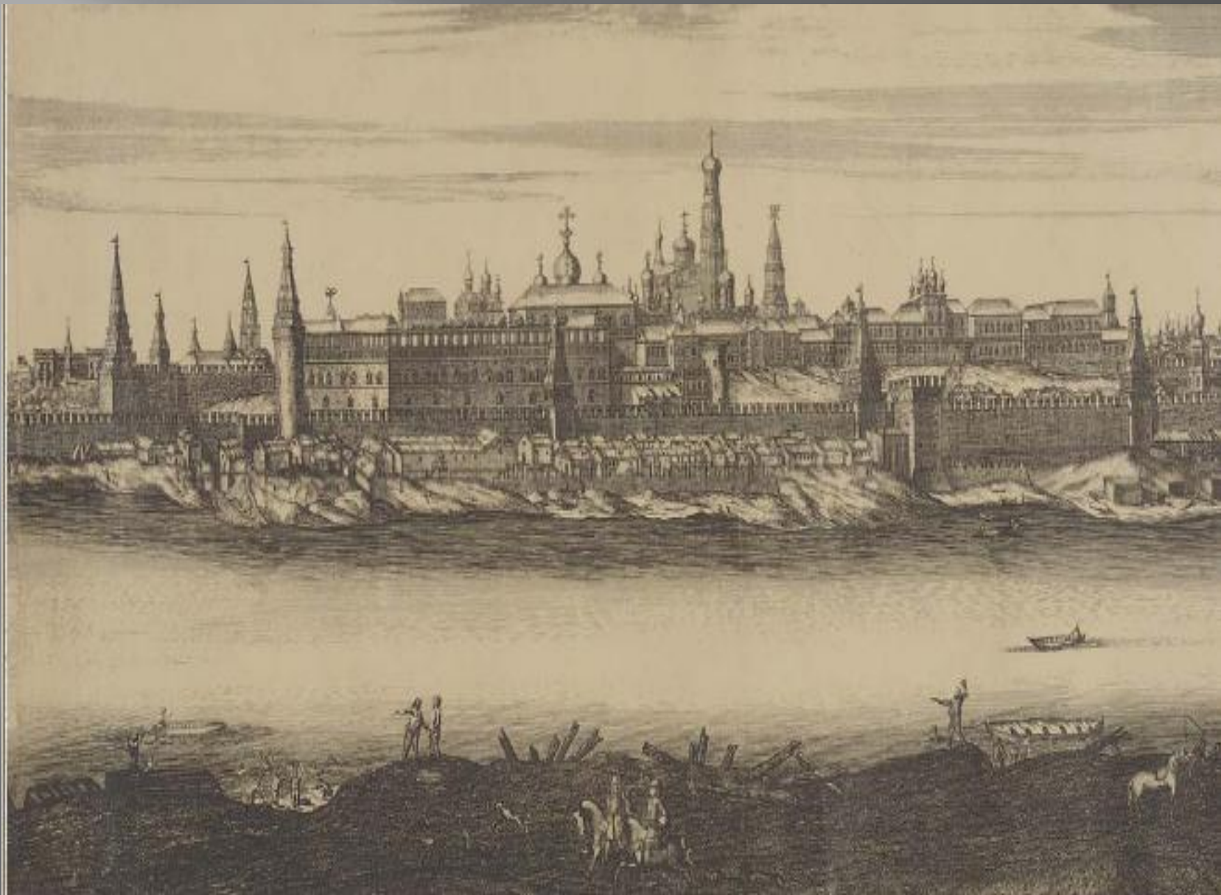
Город московской губернии