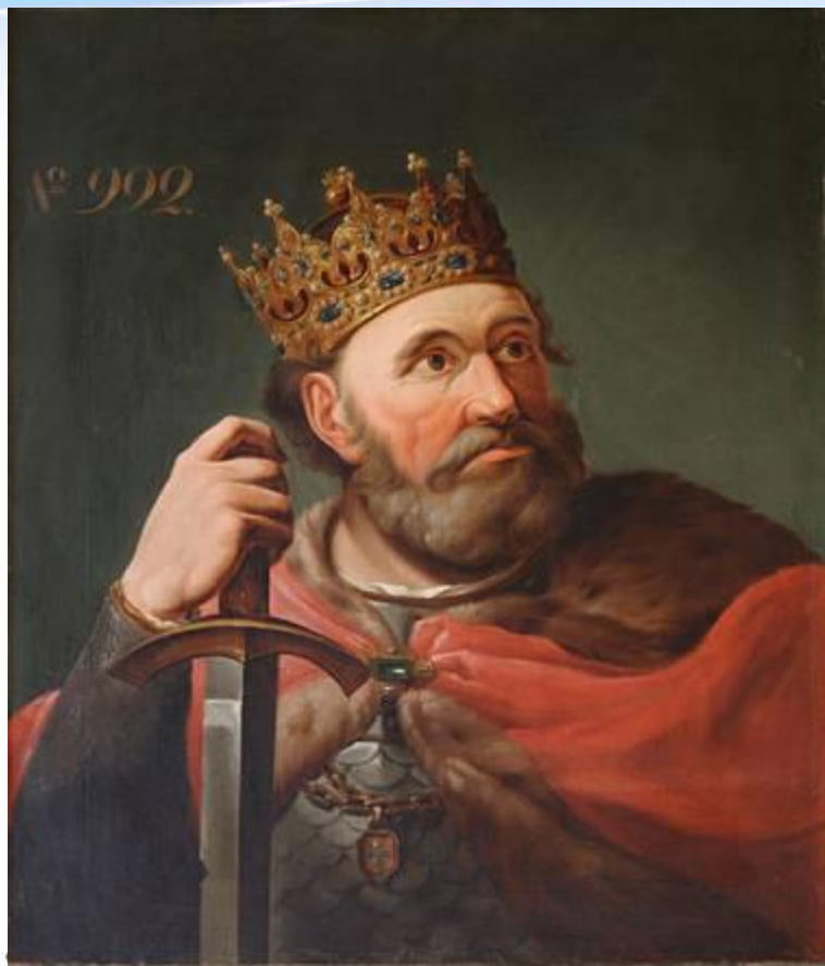
Болеслав I Храбрый

Объединение Польши завершилось в годы правления Болеслава I Храброго (992—1025). Ему удалось присоединить южные польские земли. В город Краков — крупный торговый центр на пути из Киева в Прагу — была перенесена столица Польши. Болеславу I на время удалось захватить Чехию с Прагой, но вскоре Чехия освободилась от его власти