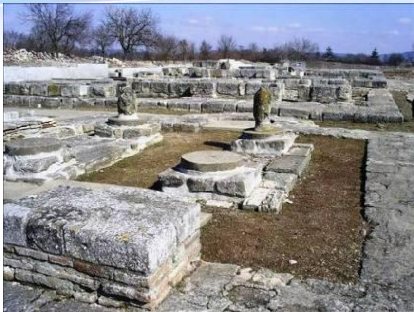
Развалины болгарского города Плиска