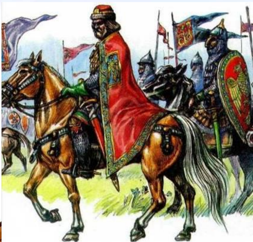
Князь с дружиной