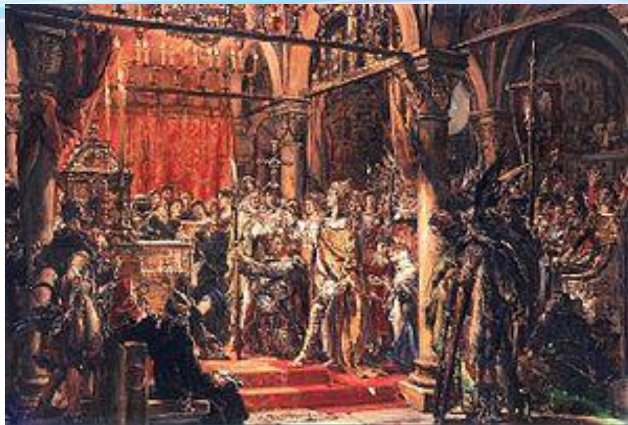
Коронация Болеслава I Храброго