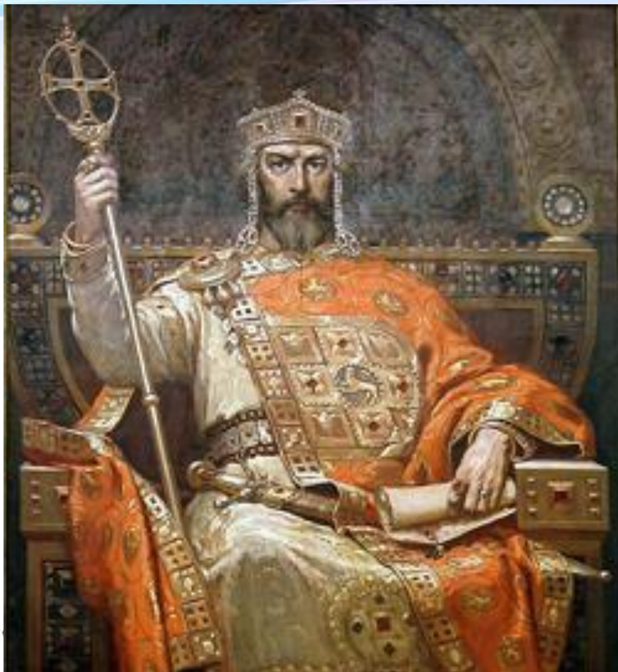
Симеон I Великий

Выдающимся правителем Болгарии был князь Симеон. Он был образованным, энергичным, честолюбивым мечтал о подчинении всего Балканского полуострова, о захвате императорского трона Византии.