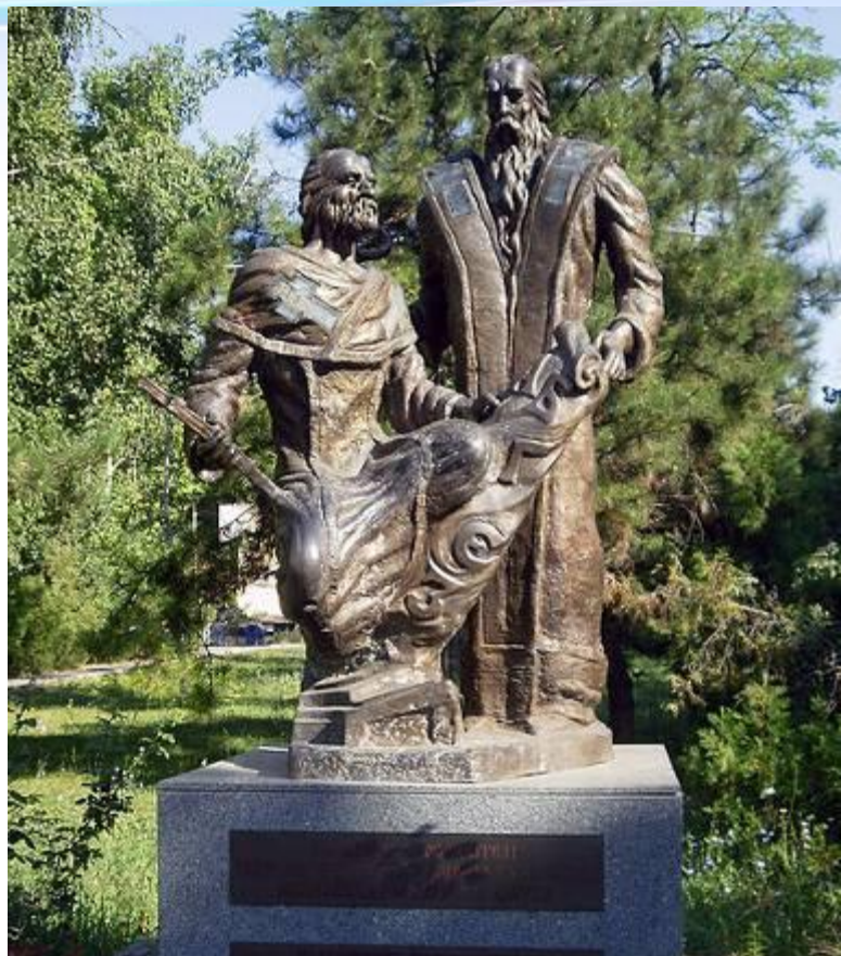
Памятник Кириллу и Мефодию Одесса

После смерти братьев немецкое духовенство начало гонения на их учеников. Некоторые ученики нашли приют в Болгарии. Здесь они продолжали переводить греческие религиозные книги, способствовали подъему болгарской литературы.