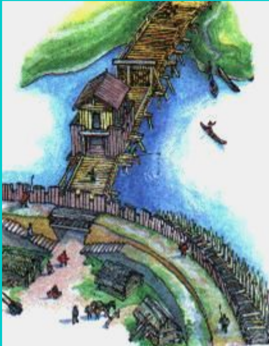
Схема крепости в Микульчице.

Для борьбы с Германией Моравия заключила союз с Византией.