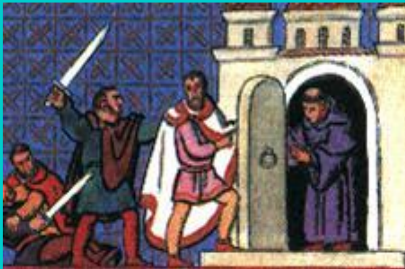
Житие Пшемысла. Миниатюра из летописи.

В начале X века из Моравской державы выделилось Чешское государство .