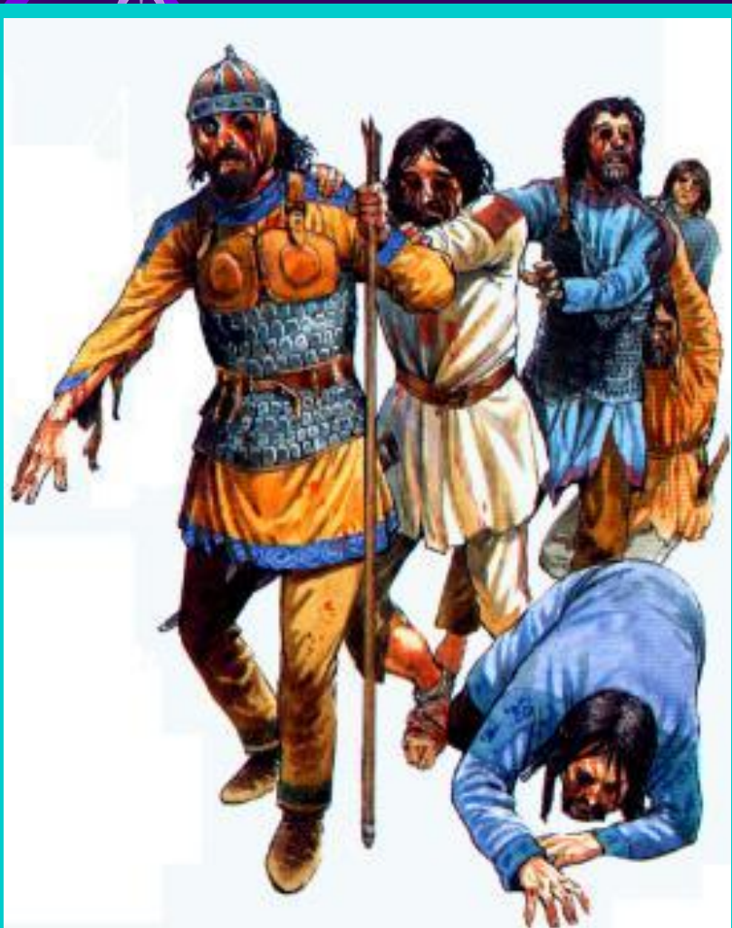
Ослепленные болгары. Современный рисунок.

Василий убил ок. 100 тыс болгар, 14 тыс. было ослеплено и в качестве устрашения отправлено домой.