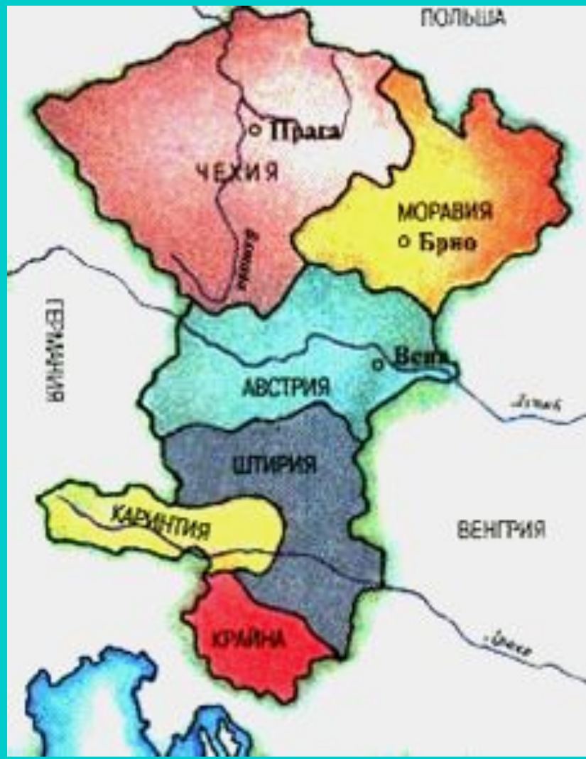
Чехия в 10-11 вв.

Болеслав стал сильным князем-он успешно боролся с Германией, подчинил соседей и границы Чехии дошли до Русских земель