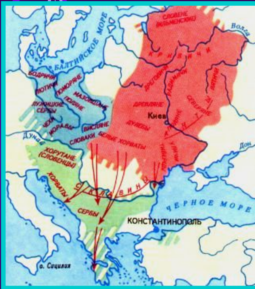
Расселение славянских племен в 6-9 вв.

Западные славяне -чехи, словаки, поляки, полабские и поморские славяне.