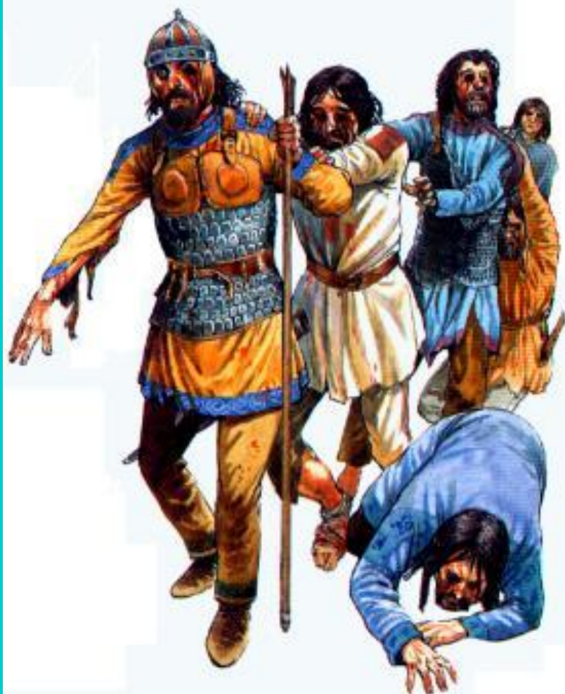
Ослепленные болгары. Современный рисунок.

Василий убил ок. 100 тыс болгар, 14 тыс. было ослеплено и в качестве устрашения отправлено домой.