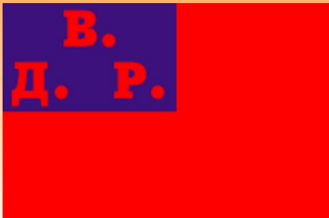
Флаг и территория ДВР