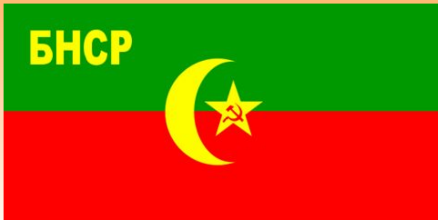
Флаг и территория БНСР

В 1920 г. при поддержке Красной Армии на территории Средней Азии были созданы Бухарская и Хивинская народные республики. Практически сразу началось противостояние с басмачами.