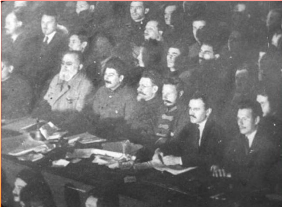
Президиум ВЦИК на I Всесоюзном съезде Советов

1924 г., 31 января – принятие на II Всесоюзном съезде Советов первой Конституции СССР