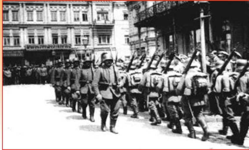
Немецкие войска в Киеве

В Гражданскую войну оказались втянуты все национальные окраины. 7 ноября Центральной радой в Киеве была провозглашена Украинская народная республика. В ответ Всеукраинский съезд Советов в Харькове провозгласил Советскую республику.