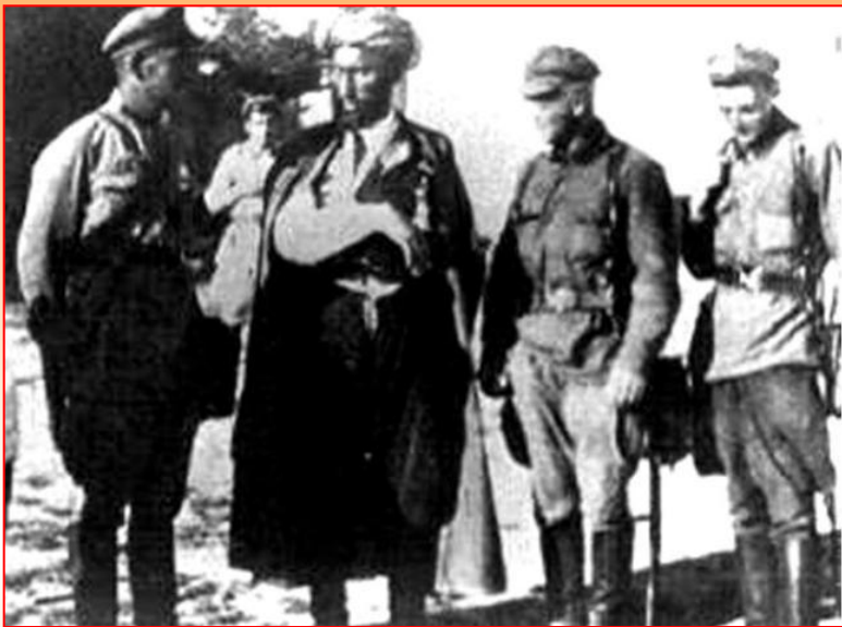
Арест предводителя банды басмачей

В 1921 г. басмачей возглавил бывший военный министр Турции Энвер Паша, надеявшийся создать союзное Турции государство.