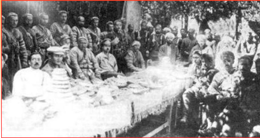
Мирные переговоры с басмачами. 1921 г.

Партия начала учитывать национальную специфику. В мусульманских республиках духовенству возвратили земли, восстановили шариатские суды, признавали мусульманские нормы поведения. На Севере и в Сибири сохранялось родовое самоуправление. Большое внимание уделялось культурному развитию малых народов - многие из них впервые получили письменность. В Москве и Петрограде были открыты институты народов Востока и Севера.