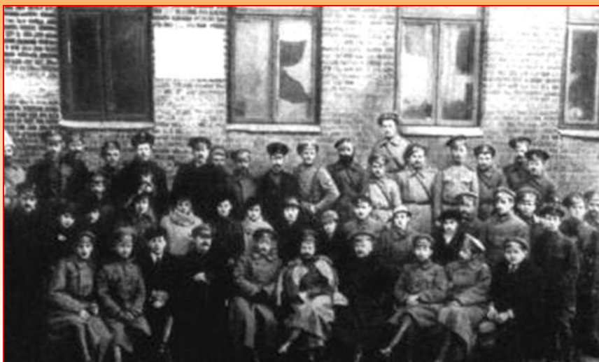
Сотрудники Красной милиции Минска. Декабрь 1917 г.

В Белоруссии, Эстонии и Латвии советская власть победила быстро, но вскоре они были оккупированы немцами. В Минске было создано буржуазное правительство отделившееся от России. В феврале 1918 г. Латвия была занята Германией, ее войска остались здесь с согласия Антанты, даже после поражения Германии. 19 ноября буржуазное правительство Эстонии подписало договор с Германией. В конце 1917 г. «Литовский совет» с согласия немцев провозгласил независимость Литвы.