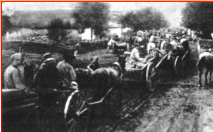
Части Латышской стрелковой дивизии в походе

13 ноября 1918 г. Советское правительство аннулировало Брестский договор и поставило вопрос об освобождении оккупированных территорий. На них начиналось вооруженное восстание.