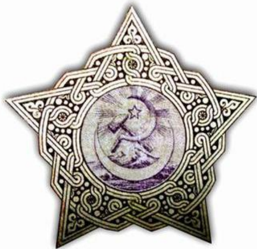
Герб и флаг ЗСФСР