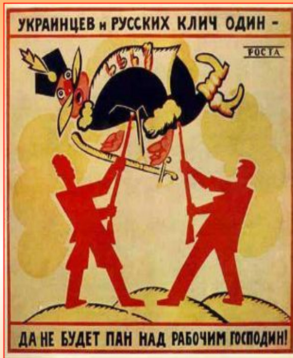
Плакат В.Маяковского. 1920 год.

После окончания войны на территории бывшей Российской империи образовалось полтора десятка государств. Самое крупное - РСФСР строилось по федеративному принципу и включало автономии и национальные округа.