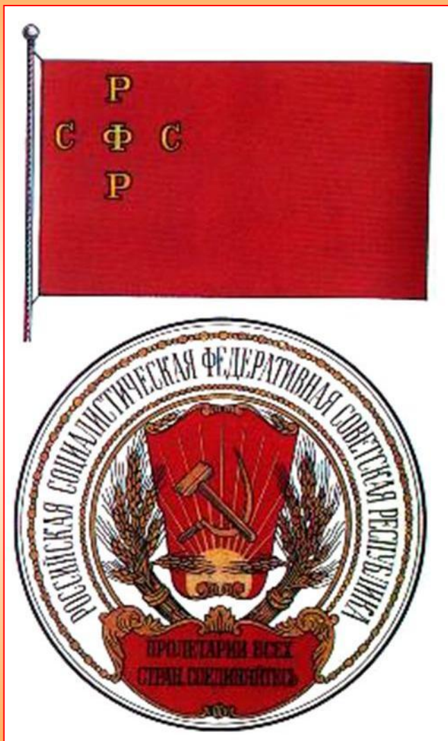
Герб и флаг РСФСР

Ряд национальных окраин вошел в состав РСФСР на правах автономий. 1 ноября 1917 г. советская власть победила в Туркестане. В конце ноября в Коканде было провозглашено местное национальное правительство, но вскоре оно было ликвидировано красногвардейцами и Туркестан вошел в состав РСФСР. В 1918 г. в состав РСФСР входили Башкирская, Татарская, Киргизская, Горская, Дагестанская республики, Чувашская, Калмыцкая, Марийская, Удмуртская области и коммуны - Карельская и немцев Поволжья.