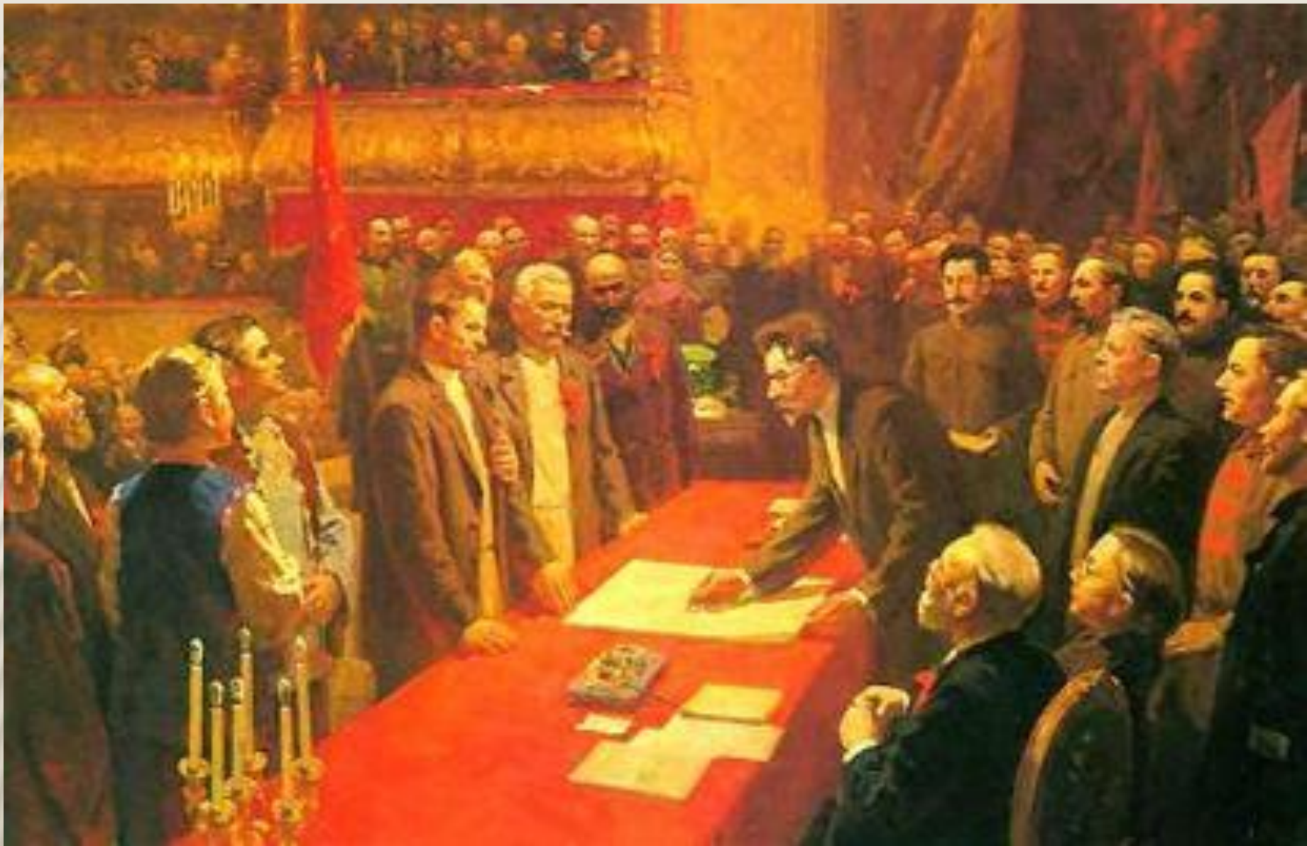
С. ДУДНИК. ПОДПИСАНИЕ ДОГОВОРА ОБ ОБРАЗОВАНИИ СССР