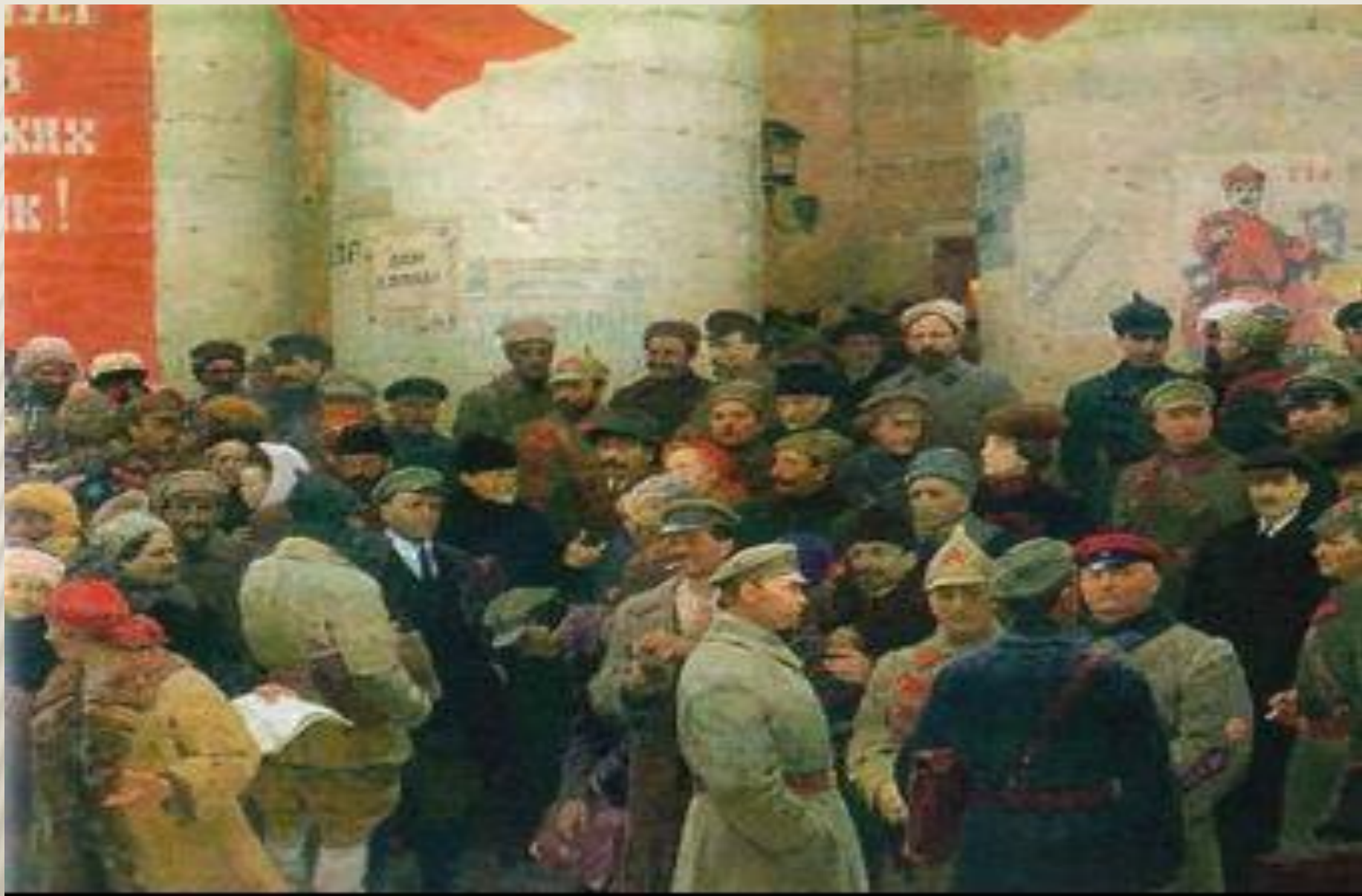
С. КОТЛЯРОВ. ОБРАЗОВАНИЕ СССР