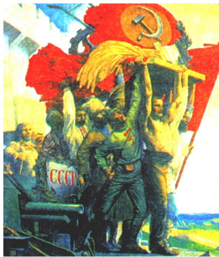
С.Карпов. Дружба народов.

Представители коренных народов привлекались к управлению государством, для них создавались льготы при приеме в ВУЗы. Но «коренизация» имела и отрицательные моменты. В Киргизии началось насильственное переселение русских с их земель. На Украине украинский язык стал государственным и без его знания нельзя было занимать никакие должности.