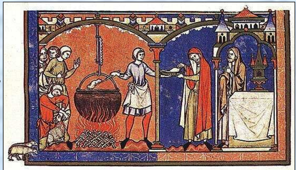
Практические занятия студентов медицинского факультета