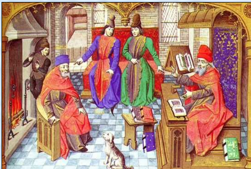
Диспут профессоров в присутствии студентов