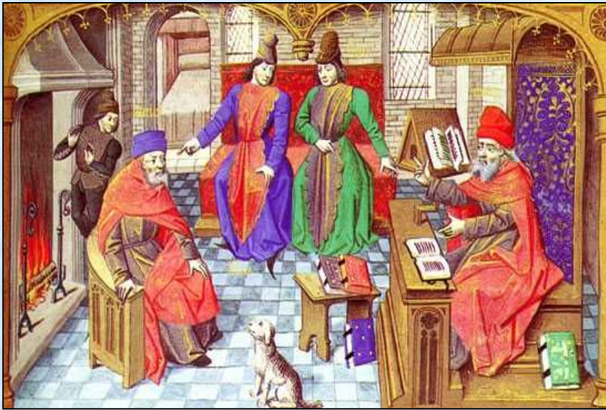
Диспут профессоров в присутствии студентов