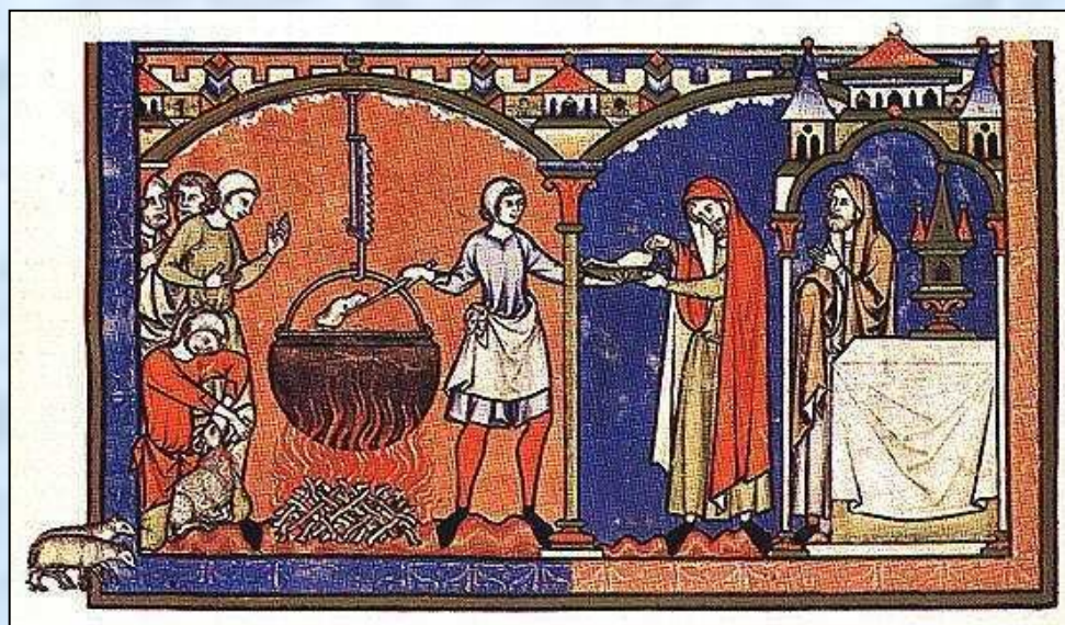
Практические занятия студентов медицинского факультета