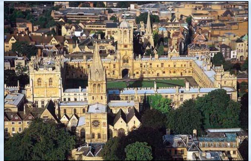
Оксфордский университет (1188 г.)