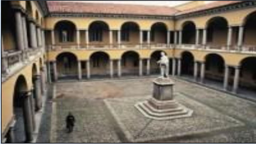
Болонский университет (1088 г.)