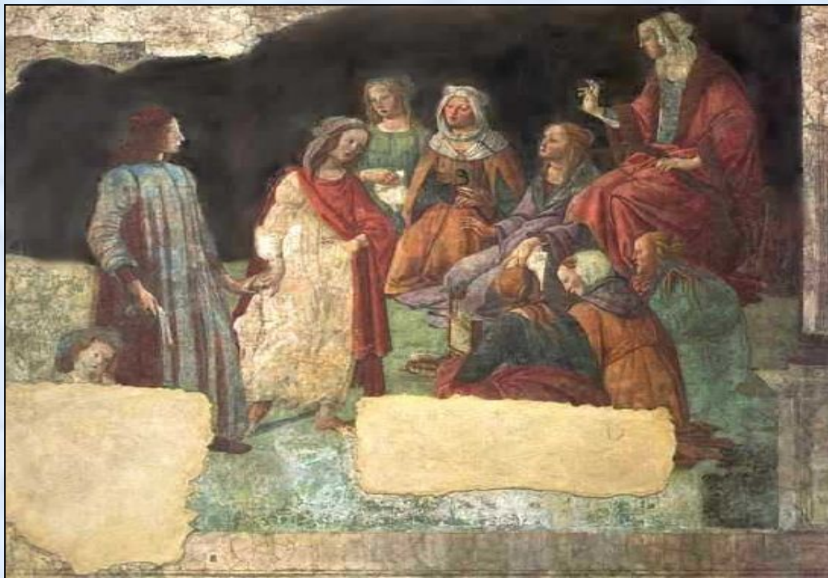
С. Ботчелли. Юноша представляется семи свободным искусствам.