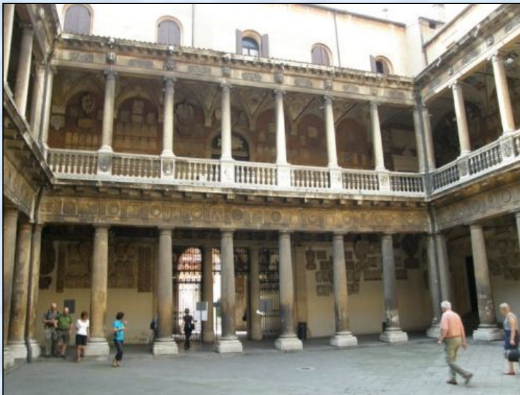
Падуанский университет (1222 г.)