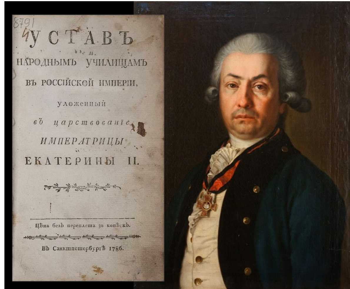
Ф. И. Янкович де Мериэво, организатор системы образования в России

Созданная по указу Екатерины II в 1782 году «Комиссия по учреждению народных училищ» разработала к 1786 году «Устав народным училищам Российской Империи». Вводилась классно-урочная система обучения. Основой образовательного процесса полагалось воспитание в учениках добросовестности, трудолюбия и прилежания. При этом категорически запрещалось причинение физического ущерба. В качестве наказаний предпочтительнее было использовать лишение приятных вещей – прогулок, участия в совместных играх и т.д. Согласно уставу, учреждались два типа училищ – малые и главные, кроме них существовали приходские училища.