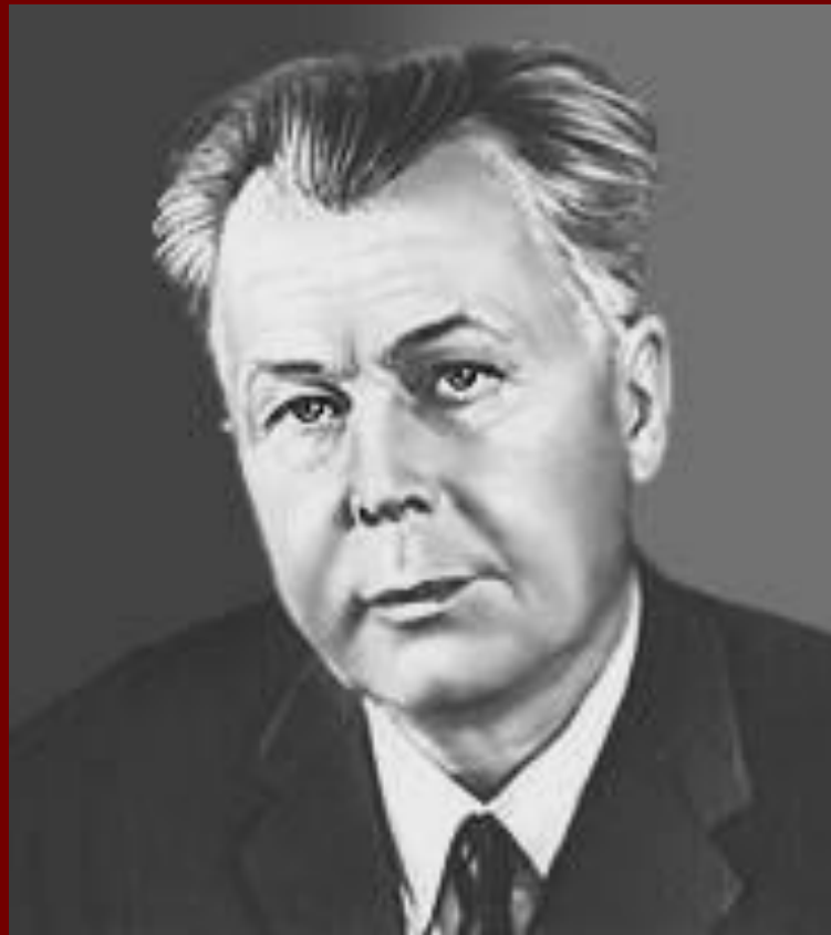
А. Твардовский «Василий Тёркин»