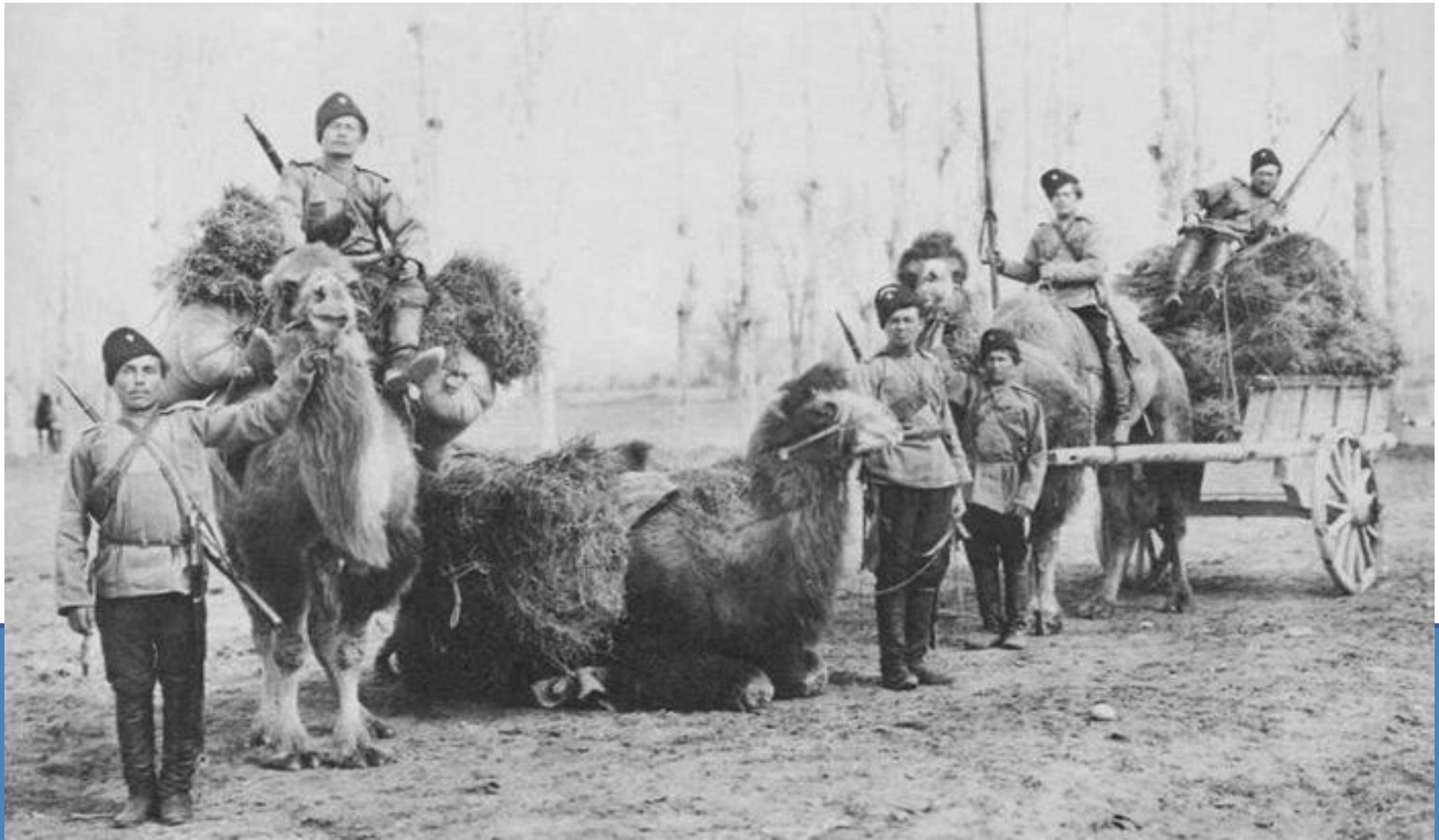
казаки 19 век