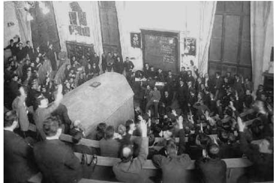
Сходка университетских студентов.

В 1910 г. бастовало 46 тысяч человек, в 1911 — 105 тысяч человек; стачки в основном носили экономический характер, их участники требовали увеличения зарплаты, отмены штрафов. В 1911 г. вузы России охватила всеобщая студенческая забастовка. В МГУ против политики Министерства просвещения выступили более 100 профессоров (К. А. Тимирязев, П. И. Лебедев, В. И. Вернадский).