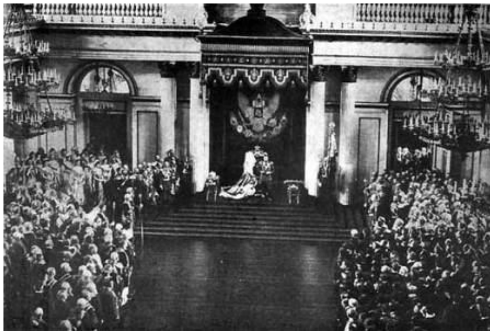
Высочайший манифест о роспуске II Государственной думы

3 июня был издан новый избирательный закон.