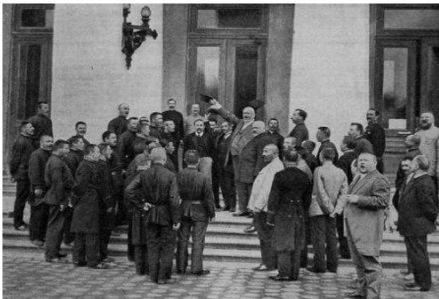
М. В. Родзянко и канцелярия Думы