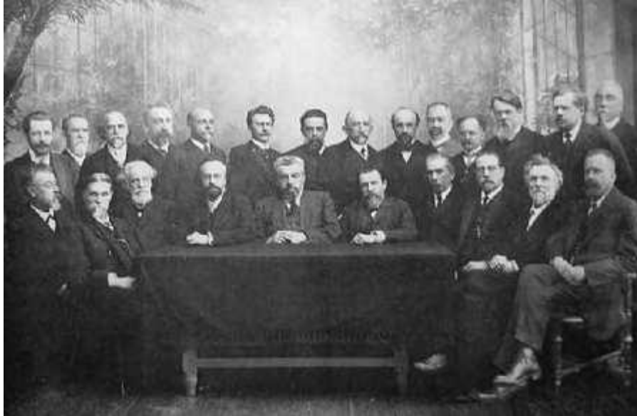
Профессора Московского университета, подавшие в отставку в знак протеста против произвола властей

Осенью 1910 г. рабочие и студенты Петербурга потребовали почтить память Льва Толстого отменой смертной казни, провели политическую демонстрацию.