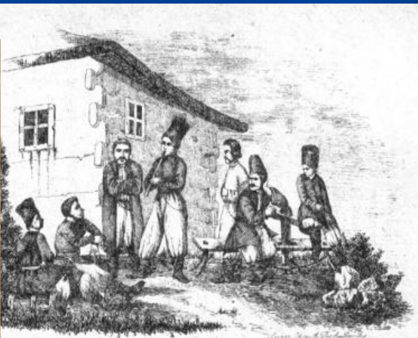
Сцени зъ народной жизни малоросинъ.