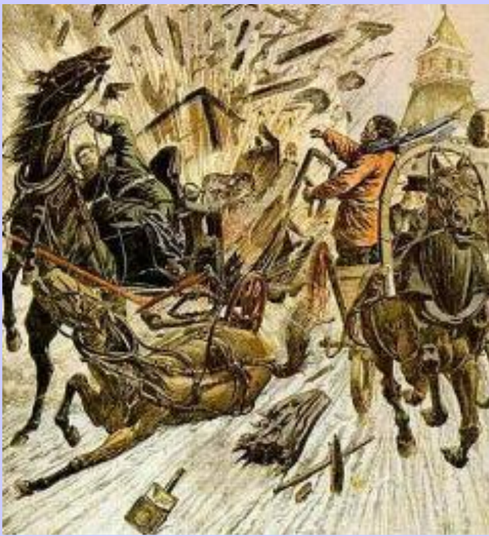
Убийство Великого князя Сергея Александровича

Главное место в программе занимал аграрный вопрос. Частная собственность на землю ликвидировалась. Земля передается в собственность общин Эсеры в качестве метода борьбы избрали террор. В 1901г. создается Боевая организация. Вскоре ее возглавил Е.Азеф-агент полиции. Уже в начале века эсеры совершили убийства В.Плеве и Великого князя Сергея Александровича, а также ряд др. террористических актов.