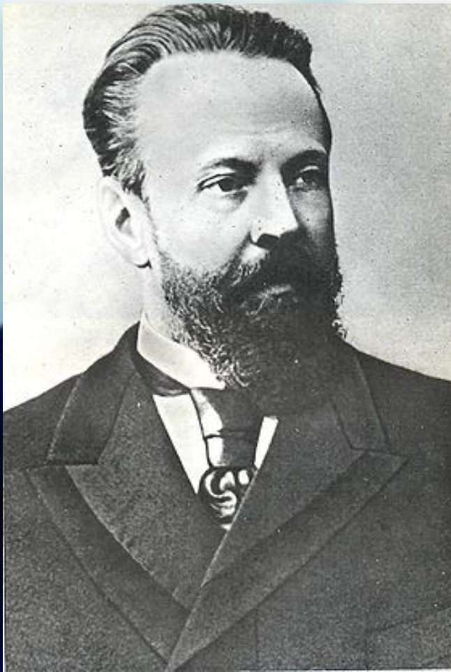
СЕРГЕЙ ЮЛЬЕВИЧ ВИТТЕ 1849 — 1915

Граф, российский государственный деятель, министр финансов России (1892—1903), председатель комитета министров, председатель Совета министров Российской империи (1905—1906).