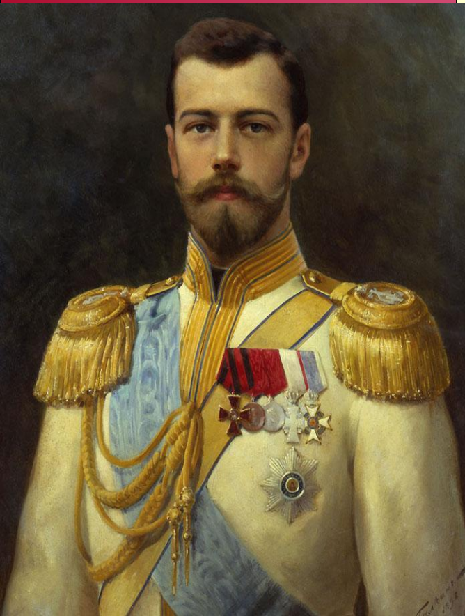
Николай II 1894-1917

- Человек средних способностей, убежден.консерватор, приверженец самодержавной формы правления.