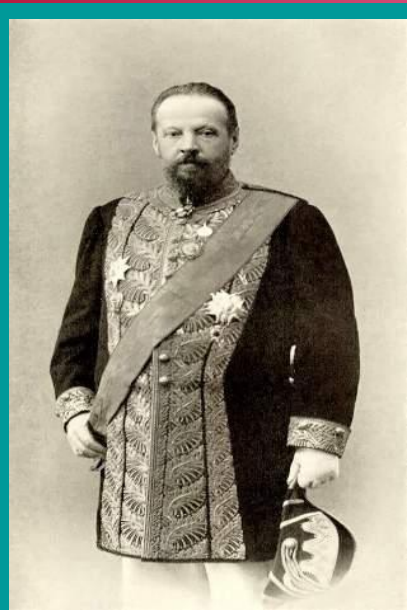
министр финансов С. Ю. Витте.