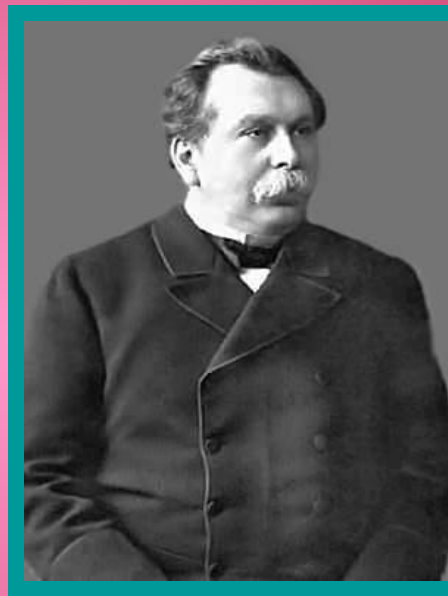
министр внутренних дел В. К. Плеве.

С одной стороны, оба министра стремились: