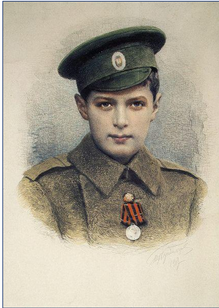
Сын Николая II- Цесаревич и Великий князь Алексей Николаевич. (1904-1918 гг.)