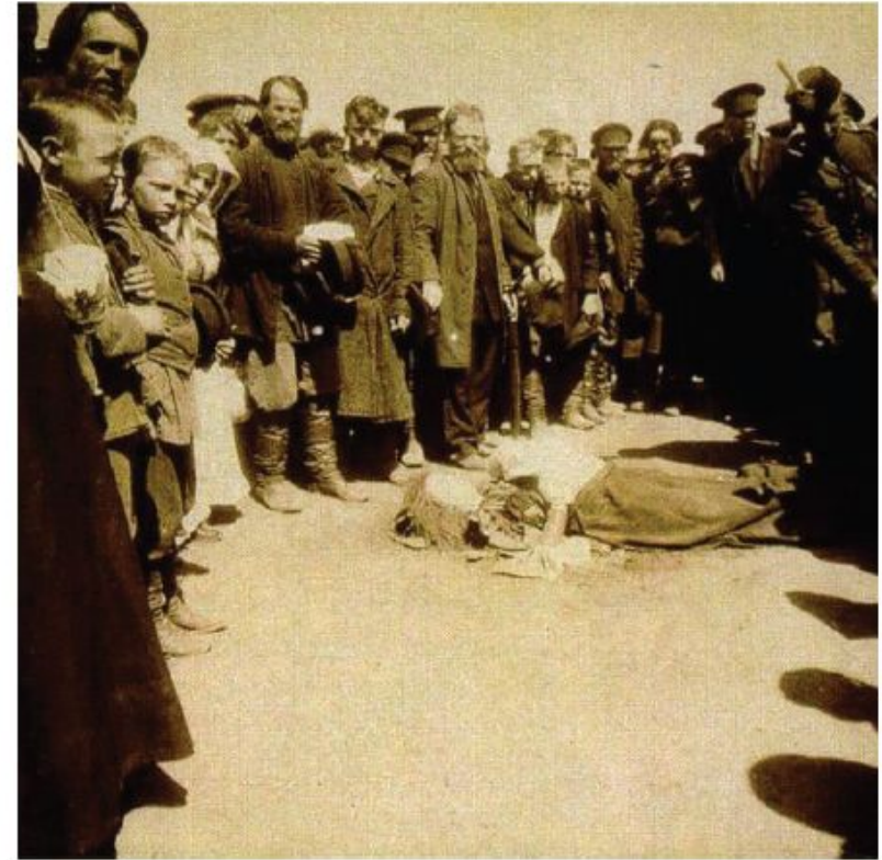
Жертвы катастрофы на Ходынке

Вскоре репутации самодержавия был нанесен куда более страшный удар. В мае 1896 г. в Москве во время гулянья на Ходынском поле по случаю коронации Николая II при раздаче царских подарков в страшной давке погибло свыше 3 тыс. чел. Потрясенная Москва ожидала, что царь объявит траур. Но дяди государя, великие князья Владимир Александрович и Сергей Александрович, убедили его вести себя так, словно ничего не случилось. Вечером кровавого дня Николай II веселился