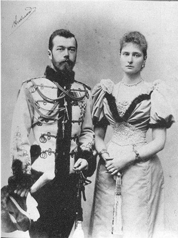
Император Николай II и императрица Александра Фёдоровна

-Примерный семьянин, находился под влиянием жены Александры Федоровны, ставил семейные интересы превыше государственных.