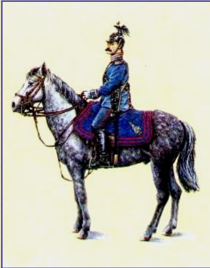
Жандарм в парадной форме