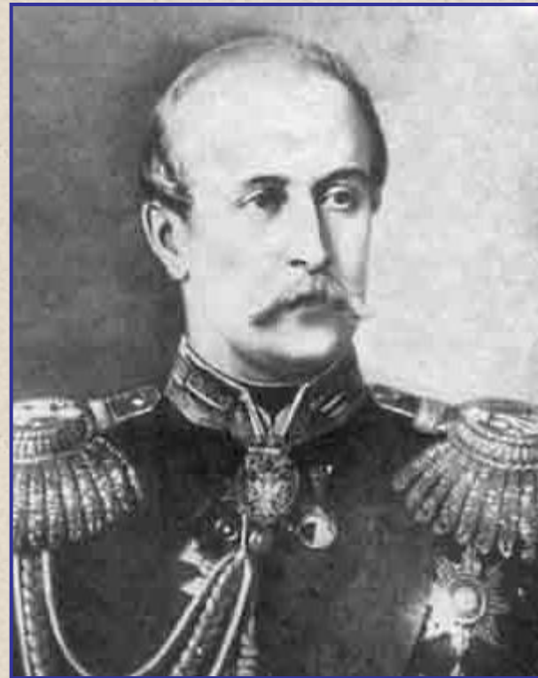
Граф П. А. Шувалов