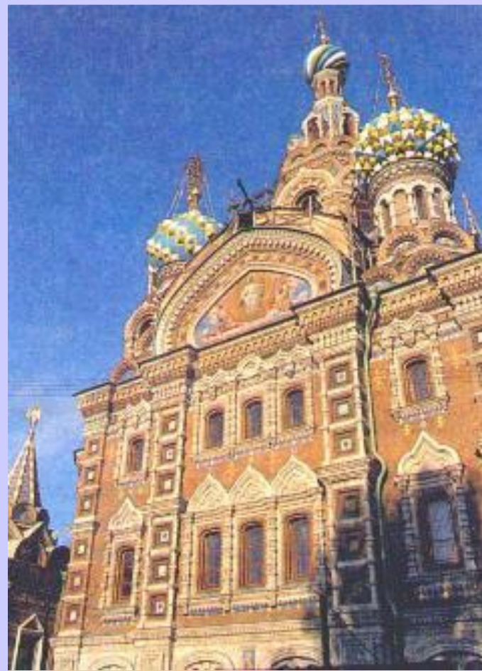
Храм Воскресения Христа на крови на месте убийства Александра II.

10.5.81 Исполнительный Комитет предложил Александру III в обмен на прекращение террора.