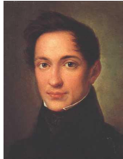
Александр Иванович Герцен