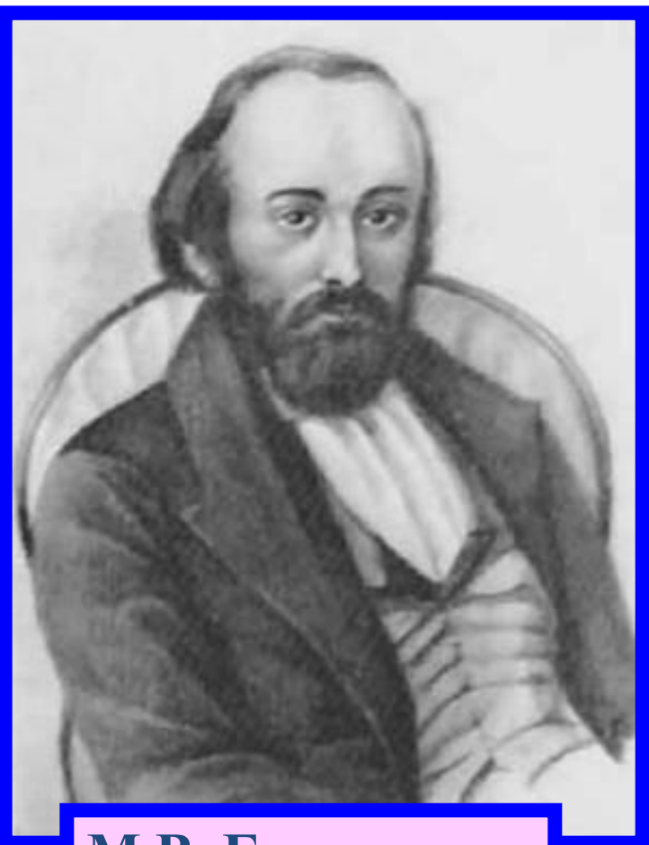
М.В. Буташевич- Петрашевский