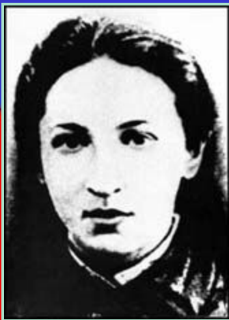
Вера Ивановна Засулич

первая российская марксистская организация; создана в 1883 в Женеве по инициативе бывших активных народников - чернопередельцев — Плеханова, Игнатова, Засулич, Дейча и Аксельрода