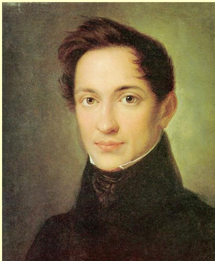
А. И. Герцен