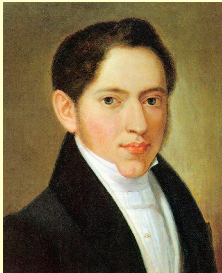
Н. П. Огарёв