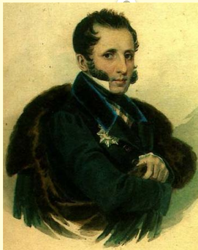
Сергей Семенович Уваров