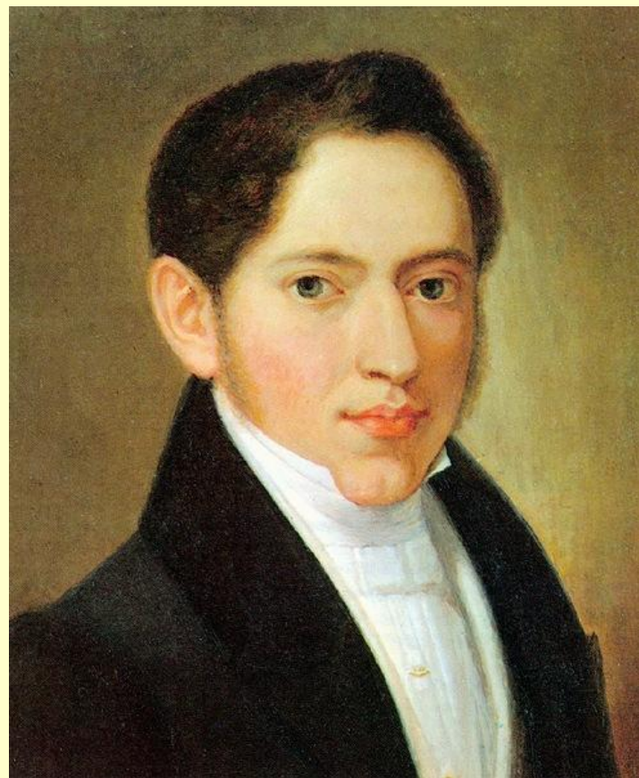
Н. П. Огарёв