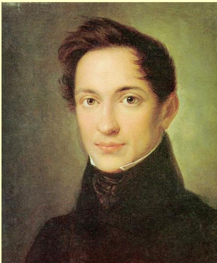
А. И. Герцен